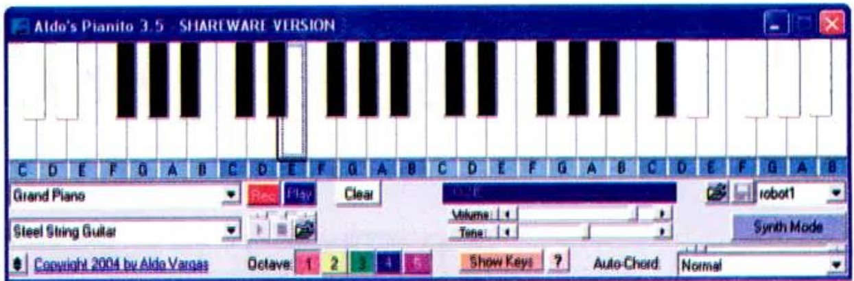
Hình 21. Hình ảnh của trò chơi Pi-a-nô

T4. Em hãy tập gõ bàn phím bằng trò chơi Pi-a-nô (phần mềm Pianito).