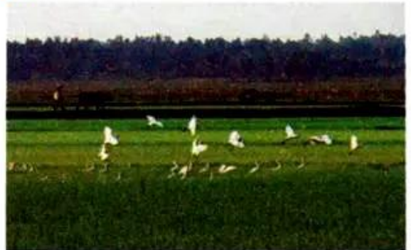
Hình 97. Đàn cò trắng

T5. Gõ đoạn thơ sau theo kiểu Telex hoặc Vni :