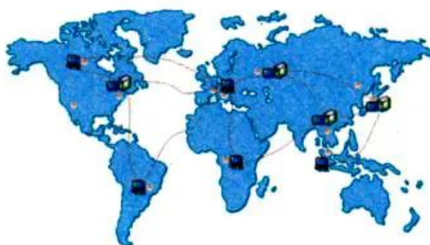
Hình 27. Mạng Internet

Rất nhiều máy tính trên thế giới được nối với nhau tạo thành một mạng lớn. Mạng đó được gọi là mạng Internet (đọc là in-tơ-nét).