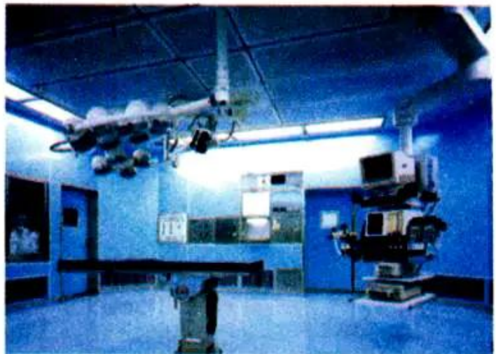
Hình 25 Máy tính trong bệnh viện