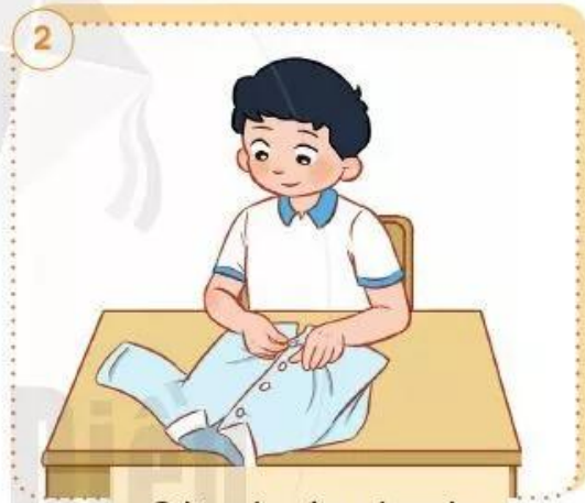
Cài cúc áo nhanh