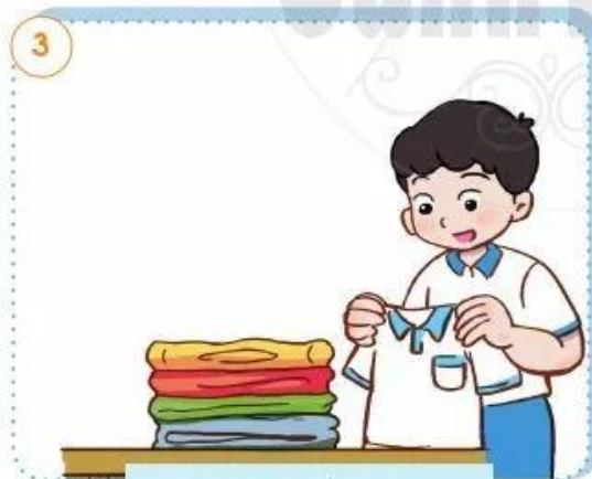
Gấp quần áo gọn gàng