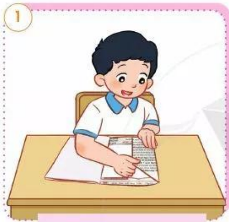
Bọc sách, vở khéo