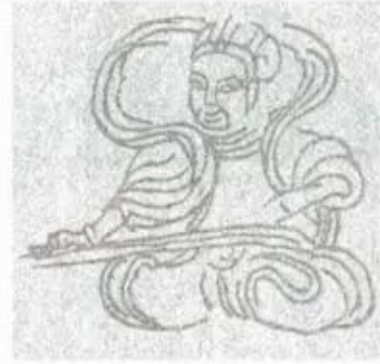
Hình 6. Hình vẽ nét các nhạc công. (Chạm khắc - Chùa Thái Lạc)