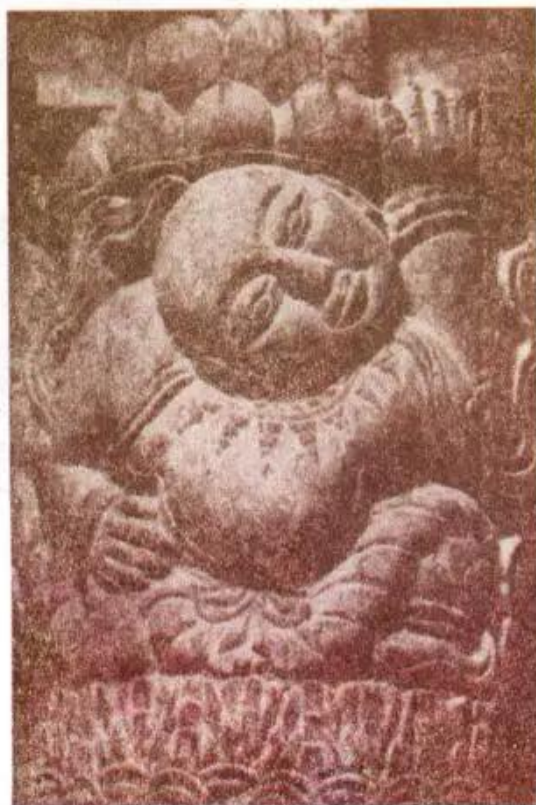
Hình 5. Người quý đỡ toà sen (Tượng gỗ - Chùa Thái Lạc)

Nội dung chủ yếu của các bức chạm khắc này là cảnh dâng hoa, tấu nhạc của những vũ nữ, nhạc công hay những con chim thần thoại Ki-na-ri (nửa trên là người, nửa dưới là chim). Hình chạm khắc được sắp xếp cân đối, không đơn điệu, buồn tẻ bởi các độ nông sâu khác nhau. Cách tạo khối tròn đầy của hình tượng tạo nên sự êm đềm, thanh tĩnh, phù hợp với những khoảng không gian vừa ảo vừa thực của lớp hoa văn dày đặc. Vì thế, các tác phẩm chạm khắc gỗ ở chùa Thái Lạc đạt được tính thẩm mỹ cao.