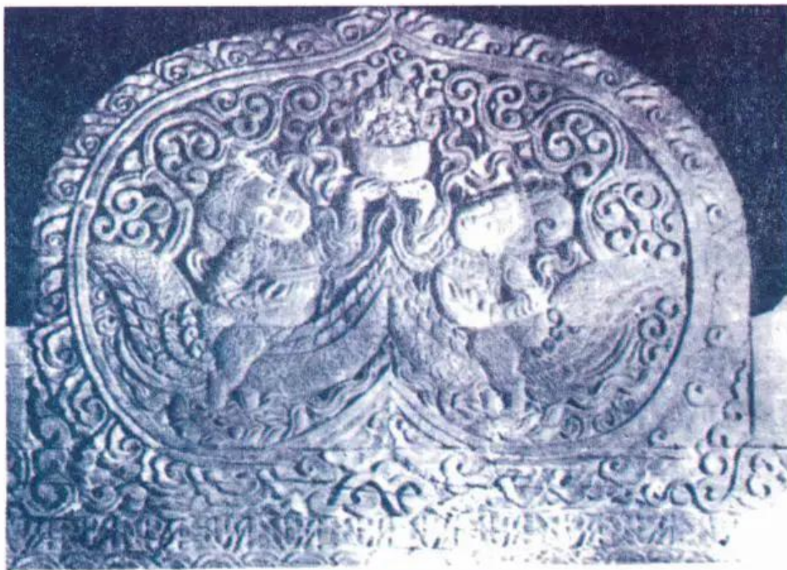
Hình 7. Tiên nữ đầu người mình chim đang dâng hoa. (Chạm khắc gỗ - Chùa Thái Lạc)