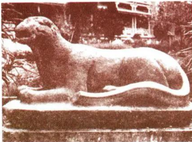
Hình 4. Hổ (Tượng đá - Lăng Trần Thủ Độ)

Tượng Hổ với kích thước gần như thật (dài 1m43, cao 0m75, rộng 0m64) có hình khối đơn giản, dứt khoát, cấu trúc chặt chẽ. Nghệ nhân xưa đã diễn tả được vẻ oai phong lẫm liệt của vị chúa sơn lâm, góp phần làm tăng thêm vẻ uy nghi của lăng Thái sư Trần Thủ Độ - một trong những người có công sáng lập nên vương triều Trần.