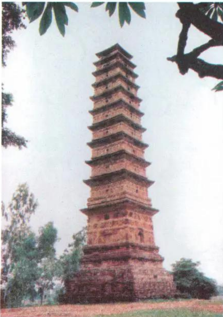
Hình 1. Tháp Bình Sơn