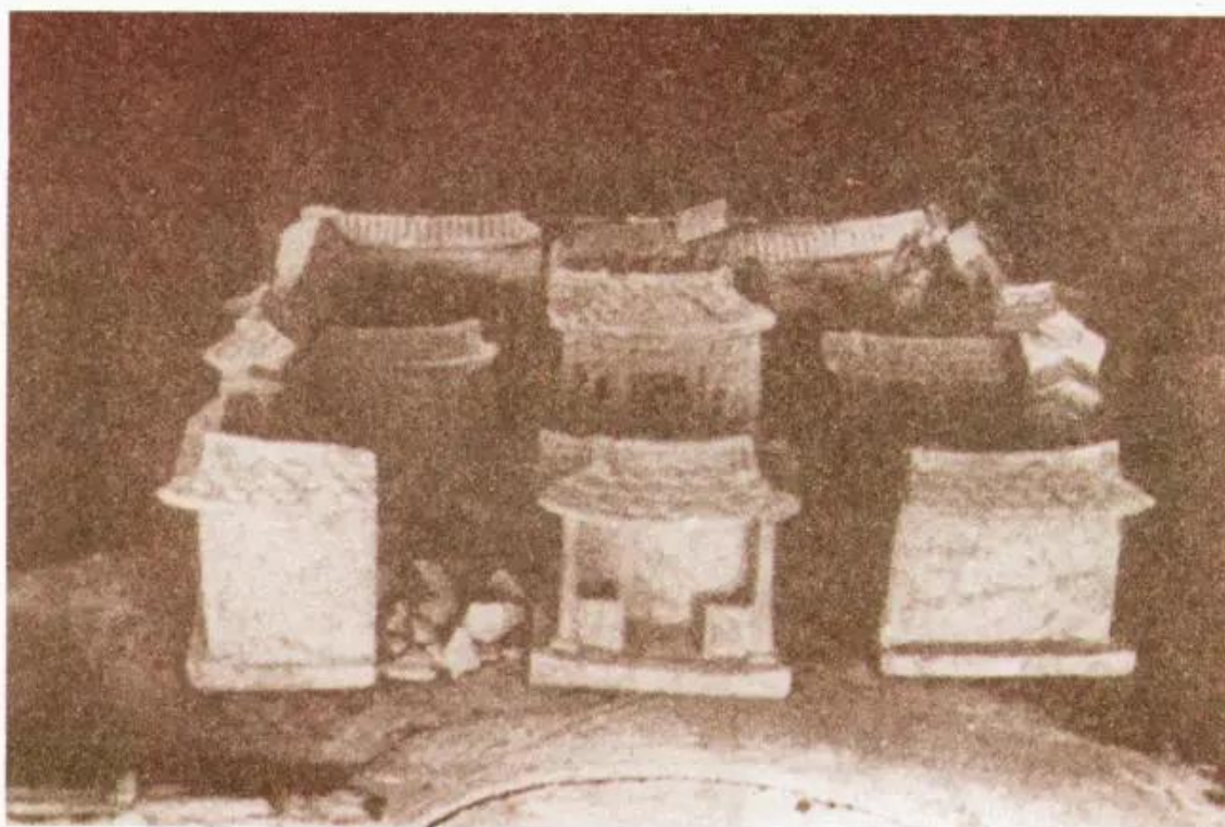
Hình 3. Mô hình nhà chôn theo mộ

Đây là khu lăng mộ lớn của các vua Trần. Các lăng mộ đều được xây cất ở chân núi, cách nhau rất xa nhưng đều quy tụ về một hướng là khu đền An Sinh. Ở đây, ngoài những điện, miếu xây ở các lăng, triều đình còn cho xây thêm nhiều toà điện, miếu lớn làm chỗ để nhà vua và hoàng tộc tế lễ hàng năm.