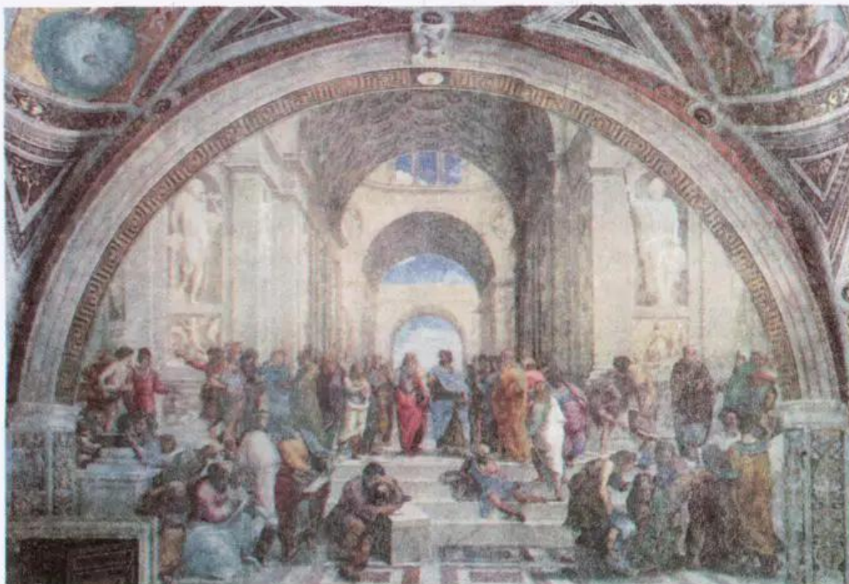
Trường học A-ten. Tranh sơn dầu của Ra-pha-en

3. Trường học A-ten là bức bích hoạ lớn của Ra-pha-en, được sáng tác vào những năm 1510 - 1512. Bức tranh diễn tả cuộc tranh luận của các nhà tư tưởng, các nhà bác học thời cổ Hi Lạp về những điều bí ẩn của vũ trụ và tâm linh. Nổi bật giữa khung cửa vòm là hai nhà triết học Pla-tông và A-ri-xtốt, xung quanh là đám đông thánh giả, các nhà thiên văn học, triết học, ... Bức tranh đã mô tả được sự rực rỡ của thời hoàng kim trong lịch sử văn hoá nhân loại. Các nhân vật đại diện cho trí tuệ của loài người như đang hiện diện và hoà hợp với mọi thời đại.