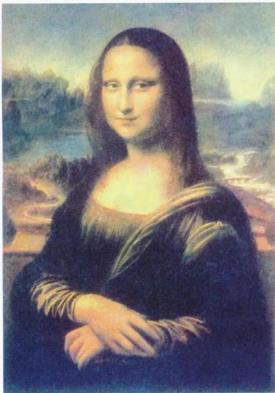
Mô-na Li-da ( La Giô-công-đơ ) Tranh sơn dầu của Lê-ô-na đơ Vanh-xi

1. Mô-na Li-da (La Giô-công-đơ) được Lê-ô-na đơ Vanh-xi sáng tác năm 1503. Bức tranh tạo nên vẻ quyến rũ bởi sự phối hợp tài tình những ngọn núi xa trập trùng ẩn hiện hoà với nụ cười kín đáo, bí ẩn của người phụ nữ đã khiến các nhà bình luận nghệ thuật tốn không biết bao nhiêu giấy mực để ca ngợi. Bầu không khí trong tranh như thấm đẫm những làn hơi nước, phủ lên hình vẽ một màn nhẹ trong suốt, tạo cho nhân vật thêm sống động và huyền bí.