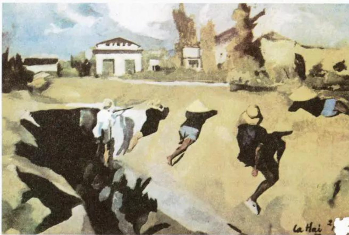
Du kích tập bắn . Tranh màu bột của Nguyễn Đỗ Cung

Năm 1996, Nhà nước truy tặng ông Giải thưởng Hồ Chí Minh về Văn học - Nghệ thuật.