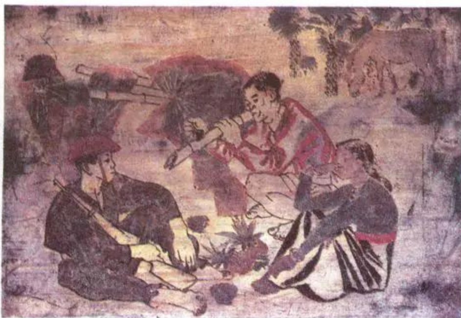
Nghỉ chân bên đống Tranh sơn mài của Tô Ngọc Vân