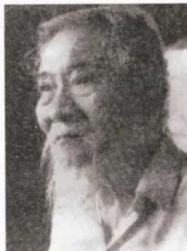
Chân dung hoạ sĩ Nguyễn Phan Chánh

Hoạ sĩ Nguyễn Phan Chánh sinh ngày 21 tháng 7 năm 1892 tại xã Trung Tiết, huyện Thạch Hà, tỉnh Hà Tĩnh. Năm 1925, ông là sinh viên khoá đầu tiên của Trường Cao đẳng Mĩ thuật Đông Dương (1925 - 1930). Sau khi được tiếp xúc với tranh lụa Trung Quốc, Nguyễn Phan Chánh bắt đầu nghiên cứu cách vẽ trên lụa. Lối vẽ của ông dựa vào kĩ thuật dựng hình châu Âu nhưng vẫn giữ được hoà sắc, bố cục và bút pháp phương Đông truyền thống. Những tác phẩm đầu tay của ông như Chơi ô ăn quan , Em cho chim ăn , Rửa rau cầu ao , Lên đồng , ... đã đạt được thành công rực rỡ.