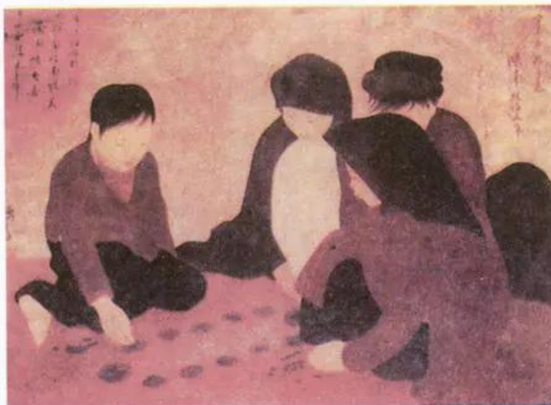
Chơi ô ăn quan Tranh lụa của Nguyễn Phan Chánh

Hoạ sĩ Nguyễn Phan Chánh mất năm 1984, hưởng thọ 92 tuổi. Năm 1996, Nhà nước truy tặng ông Giải thưởng Hồ Chí Minh về Văn học - Nghệ thuật.