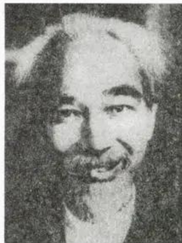
Chân dung hoạ sĩ Nguyễn Đỗ Cung