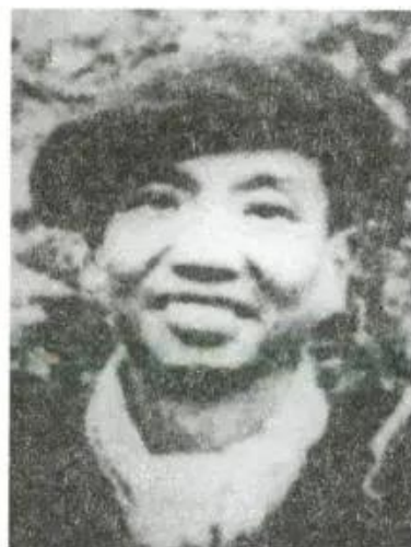
Chân dung hoạ sĩ Tô Ngọc Vân

Năm 1954, trên đường công tác trong chiến dịch Điện Biên Phủ, ông đã anh dũng hi sinh. Năm 1996, Nhà nước truy tặng ông Giải thưởng Hồ Chí Minh về Văn học - Nghệ thuật.