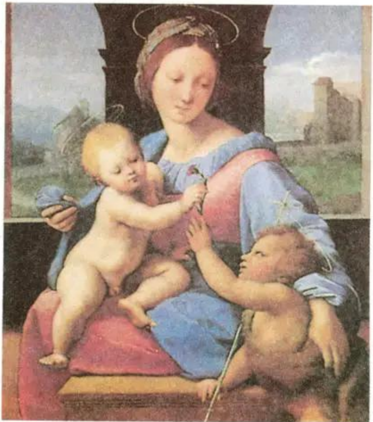
Ma-đôn-na Tranh sơn dầu của Ra-pha-en