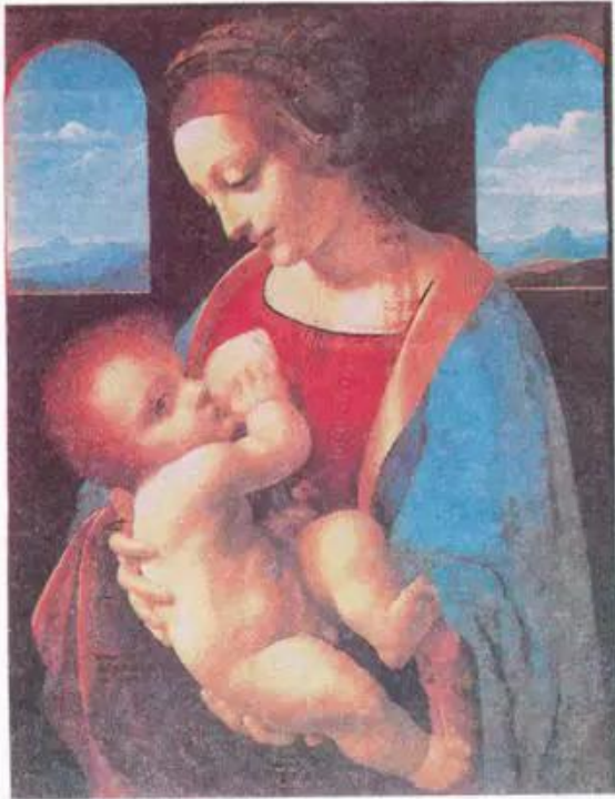
Đức Mẹ và Chúa Hài đồng Tranh sơn dầu của Lê-ô-na đơ Vanh-xi