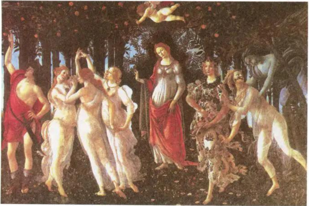
Mùa xuân. Tranh sơn dầu của Bốt-ti-xen-li