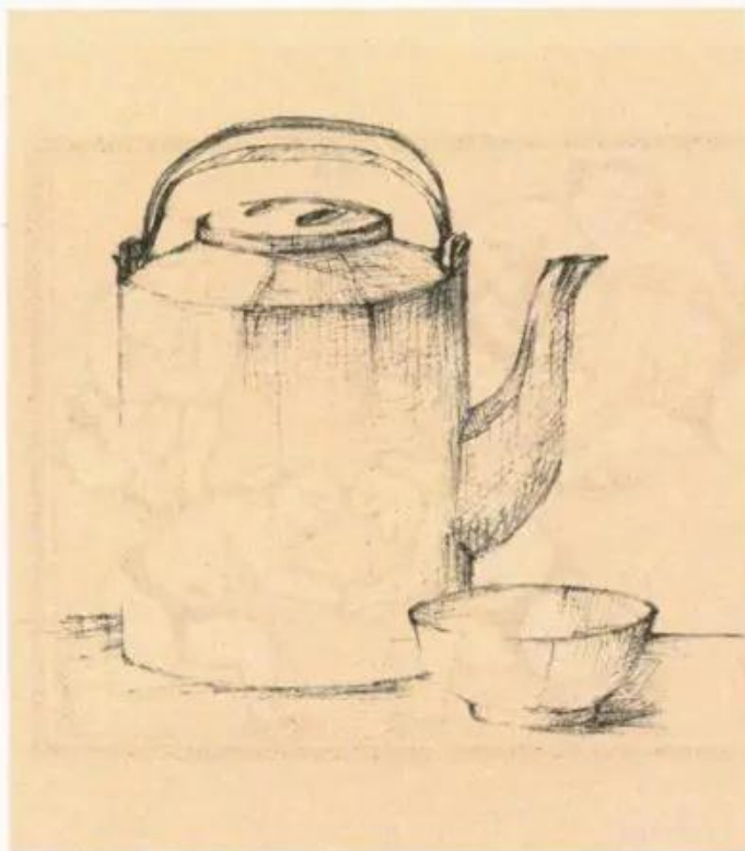
b) Vẽ đậm nhạt