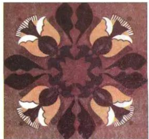
Hình 1. Một số hoạ tiết trang trí trên lọ hoa, đường diềm, hình vuông và hình chữ nhật