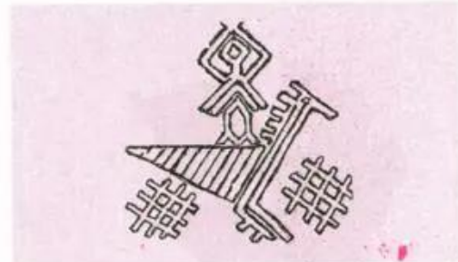
Hình 3. Hoa tiết người và chim trang trí trên vải thổ cẩm