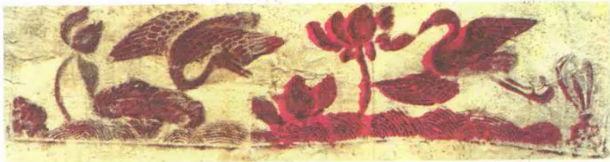
Hình 4. Hoa tiết chim và hoa sen