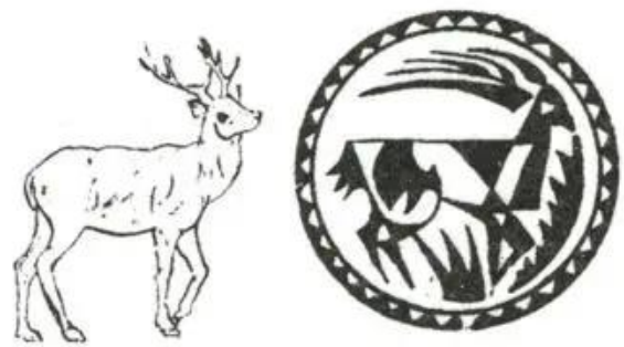
Hình 8. Hình hươu từ kí hoạ và được vẽ cách điệu thành hoạ tiết trang trí