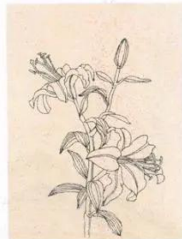
Hình 5. Hình hoa lá ghi chép từ mẫu thật