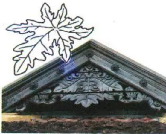
Hình 7. Hình lá được cách điệu và đưa vào trang trí trong kiến trúc