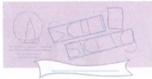
b) Vẽ hình chính