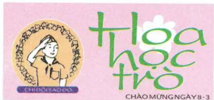
Hình 1. Đầu báo tường chào mừng ngày 8-3. (Bài tham khảo)