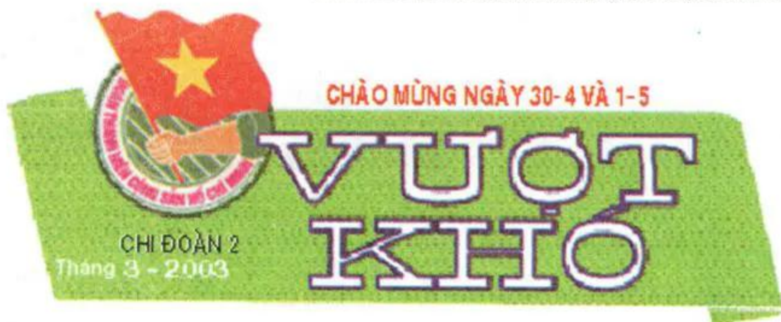
Hình 2. Đầu báo tường chào mừng ngày 30-4 và 1-5. (Bài tham khảo)