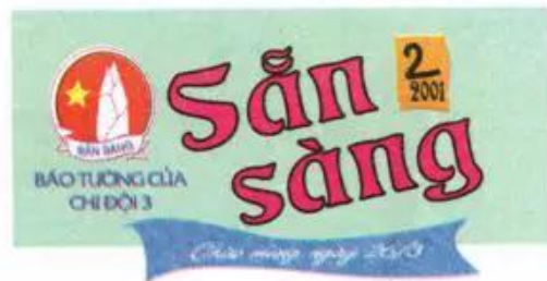
d) Vẽ màu