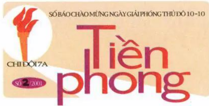
Hình 3. Đầu báo tường chào mừng ngày giải phóng Thủ đô (Bài tham khảo)