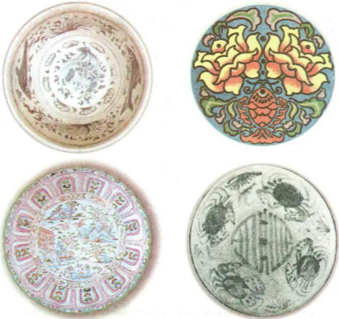
Hình 1. Một số đĩa tròn được trang trí