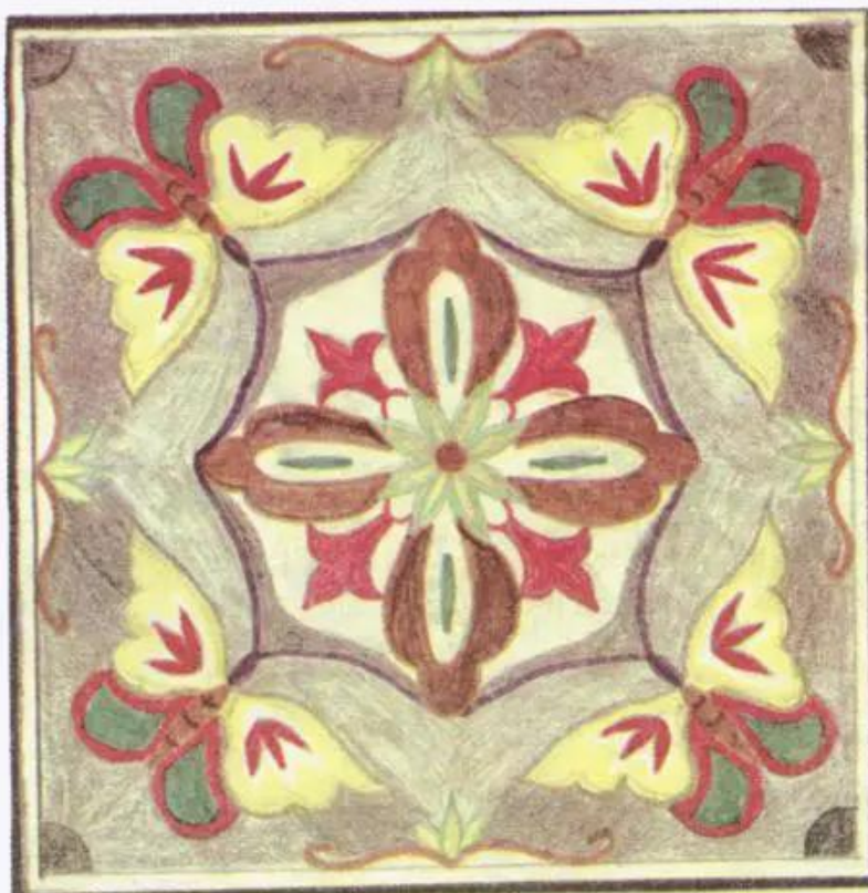
Hình 2. Trang trí hình vuông Bài vẽ của học sinh (Bài tham khảo)