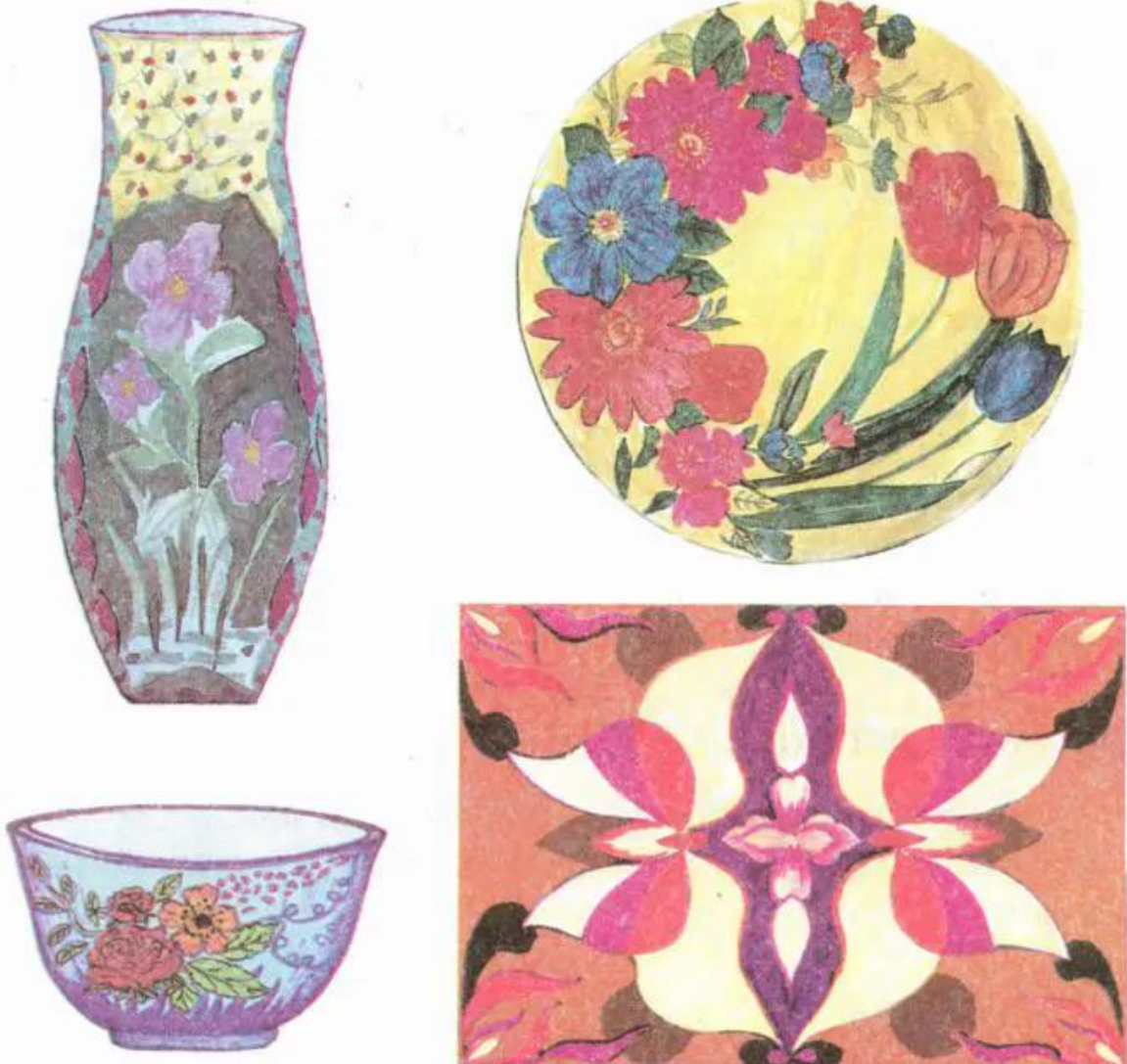
Hình 1. Một số bài trang trí của học sinh. (Bài tham khảo)