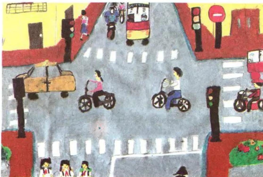
Đèn xanh, đèn đỏ. Tranh màu bột của học sinh