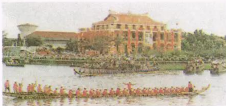
Hình 7. Bến cảng Nhà Rồng