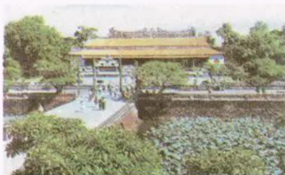
Hình 5. Cố đô Huế