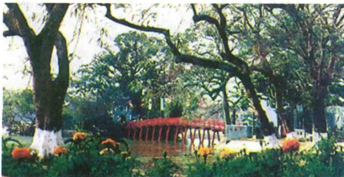
Hình 1. Đền Ngọc Sơn

Ở miền Bắc, chúng ta đã làm quen với những địa danh lịch sử như Pác Bó, Đền Hùng và các thắng cảnh như Tam Đảo, Sa Pa, Hạ Long, ... ; nhiều đình chùa, miếu mạo ở Bắc Ninh, Hà Nam, Nam Định, Ninh Bình, Thái Bình, Hà Tây, Hoà Bình, ... Ở miền Trung có kinh thành Huế và những khu lăng tẩm của vua quan triều Nguyễn (Huế), Tháp Chàm, khu phố cổ Hội An. Ở miền Nam có bến cảng Nhà Rồng, chợ Bến Thành, công viên Đầm Sen, bãi biển Vũng Tàu, núi Bà Đen, các miệt vườn nhiều cây trái của đồng bằng sông Cửu Long... Đây là nguồn đề tài phong phú để chúng ta có thể vẽ những bức tranh về cảnh đẹp đất nước.