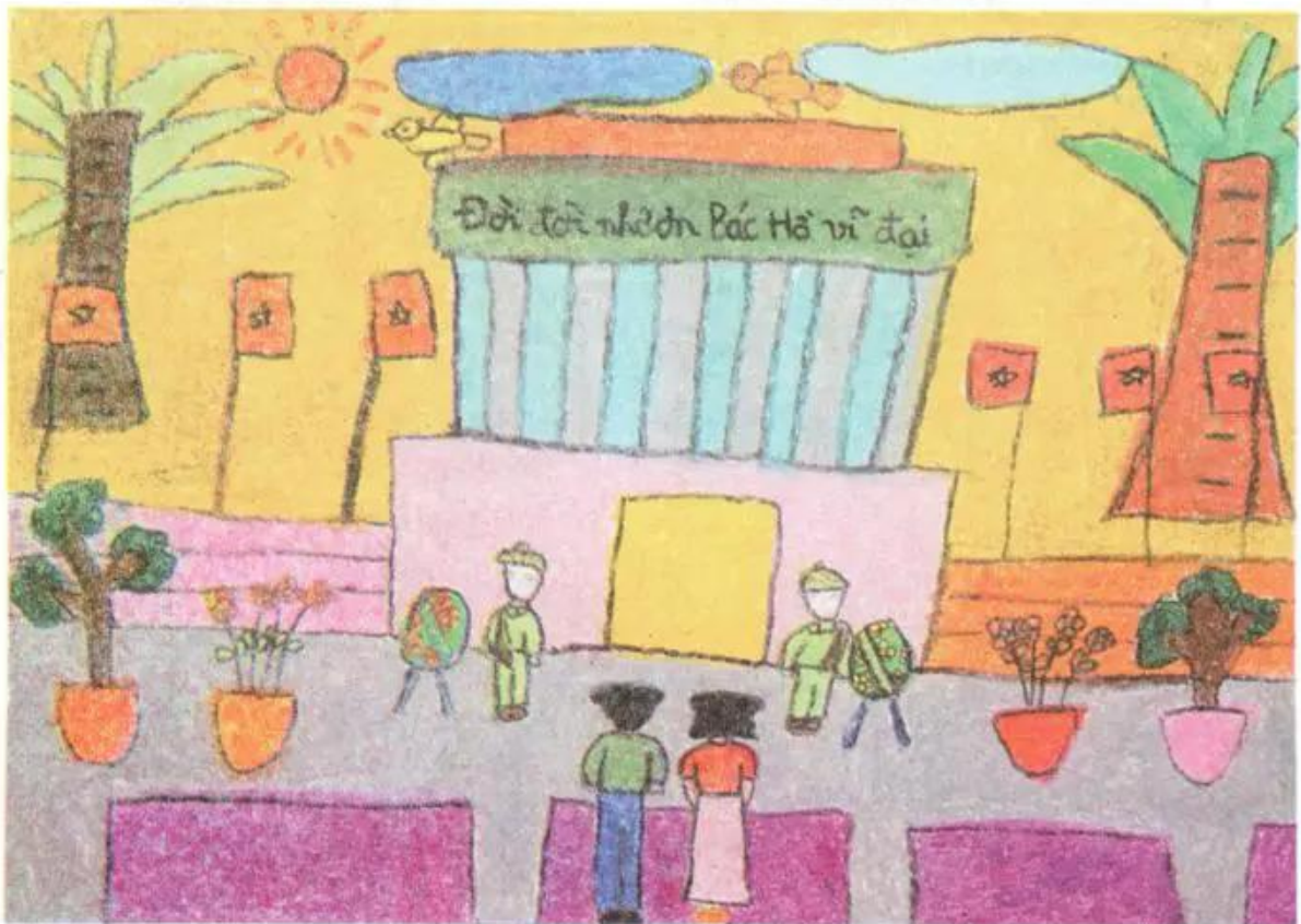
Lăng Bác Hồ. Tranh màu bột của học sinh