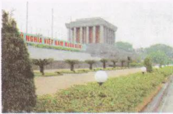
Hình 2. Lăng Chủ tịch Hồ Chí Minh