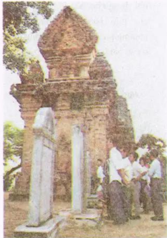
Hình 6. Tháp Chăm