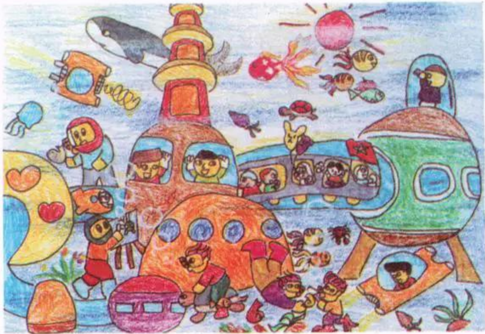
Ước mơ đi tham quan du lịch dưới đáy biển. Tranh sếp màu của học sinh