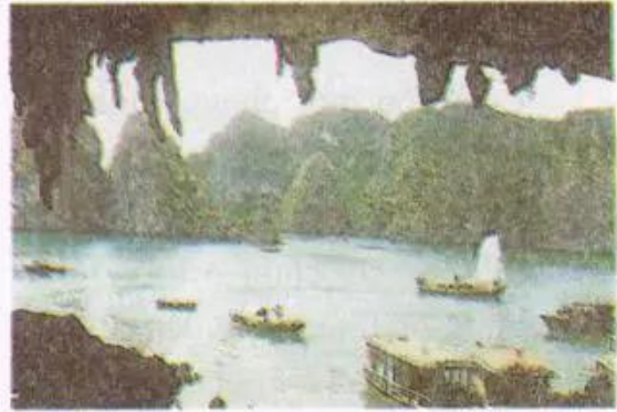
Hình 3. Vịnh Hạ Long