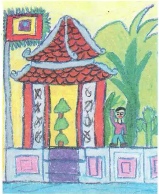
Ngôi đền. Tranh sáp màu của học sinh

Sau khi đã xác định được đề tài, nội dung cho bức tranh định vẽ, em tiến hành các bước như phương pháp chung đã hướng dẫn ở các bài học trước.