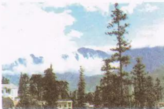
Hình 4. Phong cảnh Sa Pa