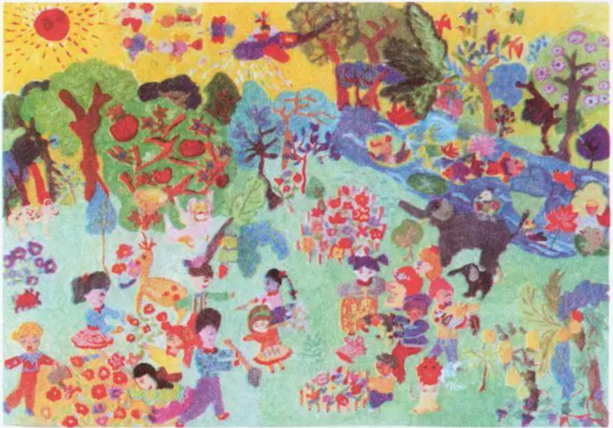
Chăm sóc cây. Tranh màu bột của học sinh