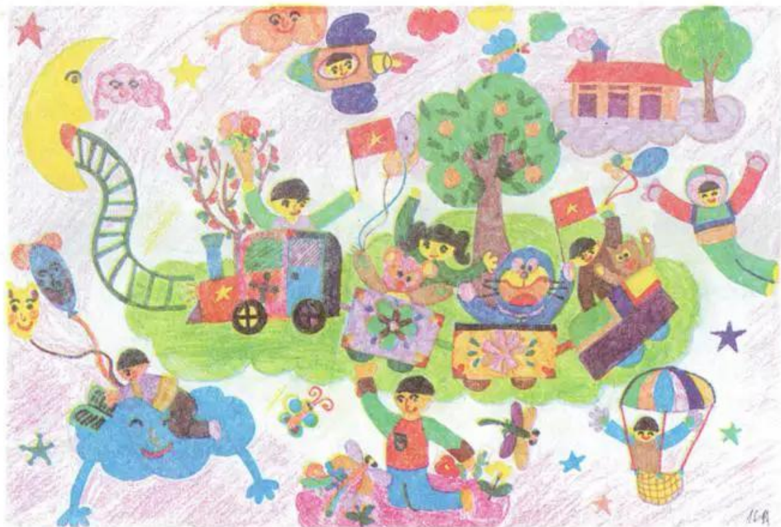
Đi chơi công viên. Tranh sáp màu của học sinh