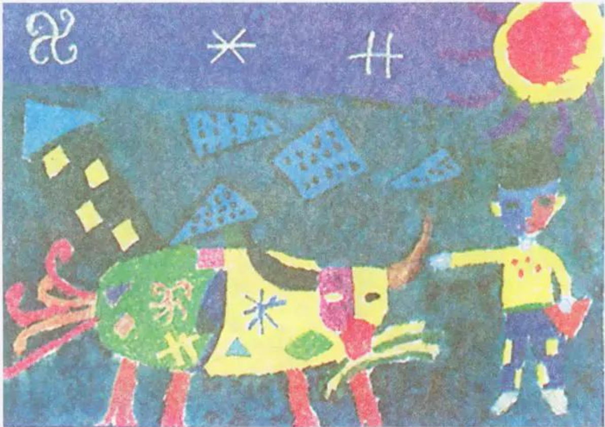
Đi chăn trâu. Tranh màu bột của học sinh