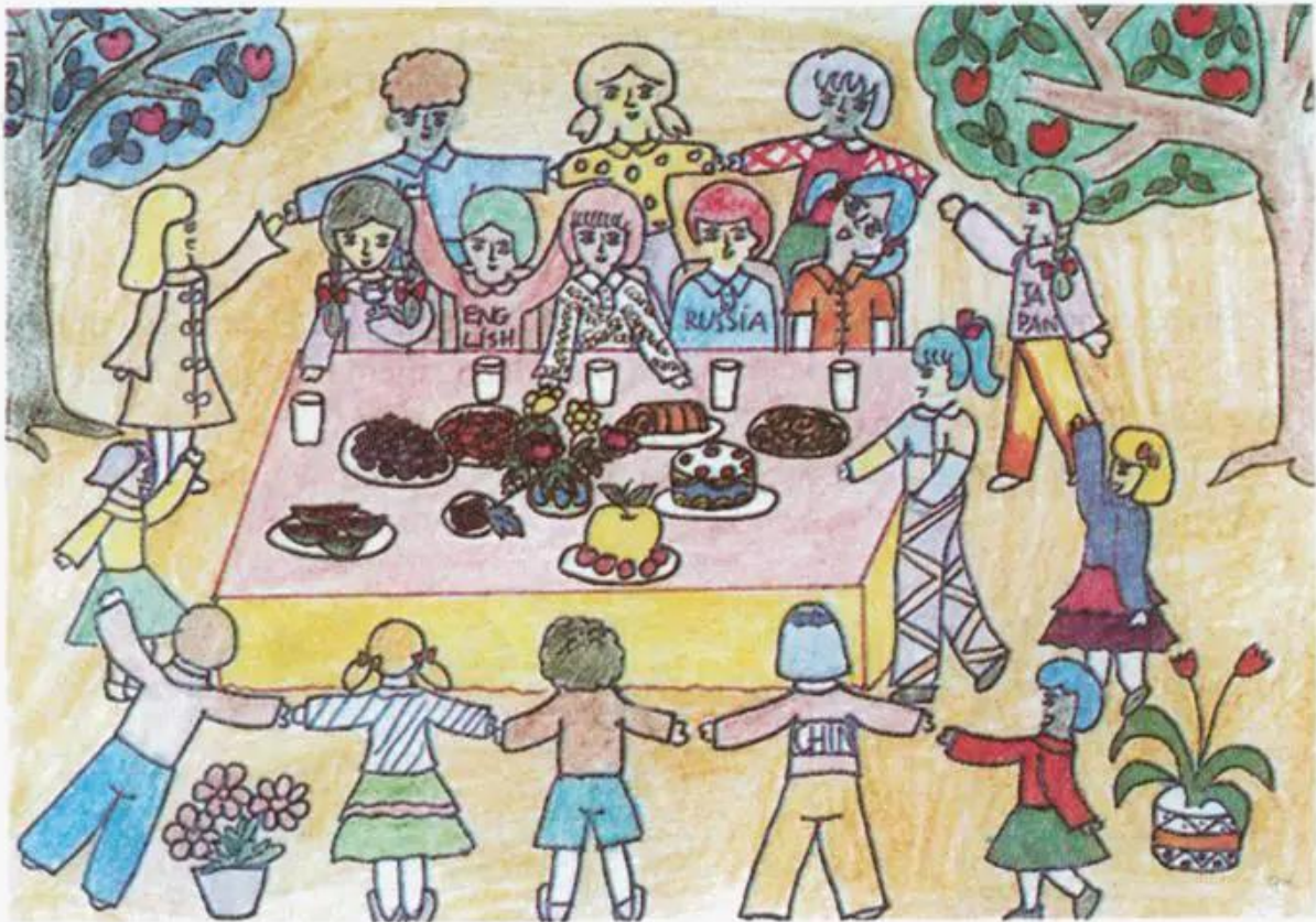
Dự trại hè quốc tế. Tranh sếp màu của học sinh