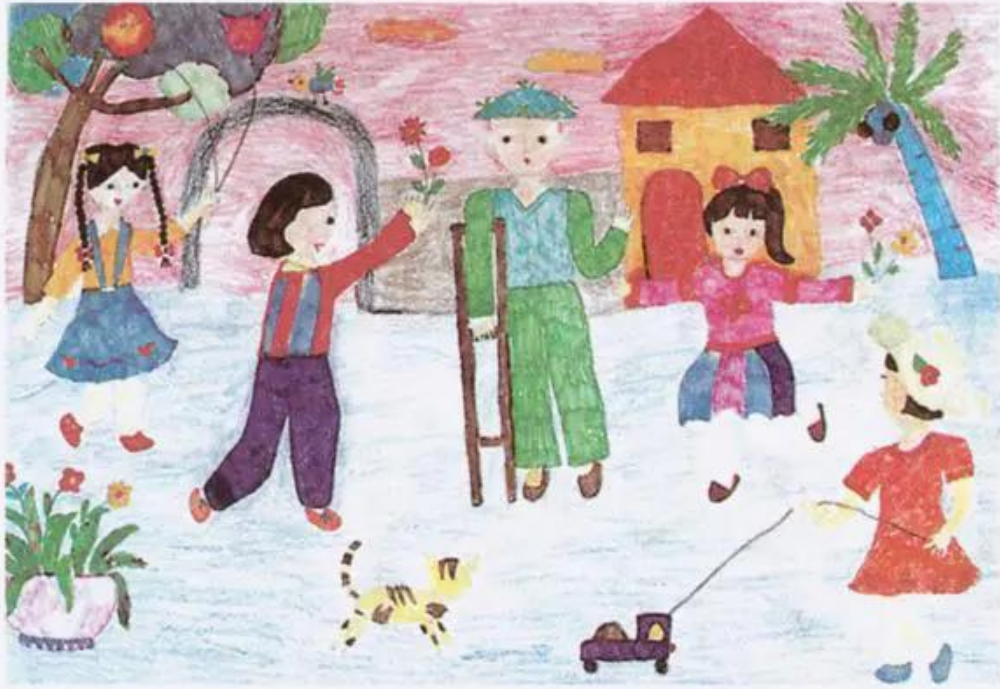
Thăm chú thương binh. Tranh sếp màu của học sinh