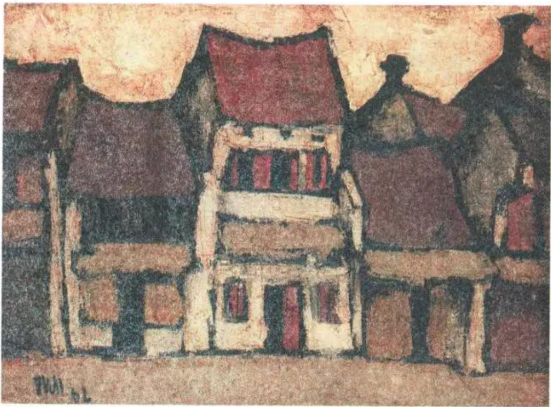
Phố cổ Hà Nội. Tranh sơn dầu của Bùi Xuân Phái