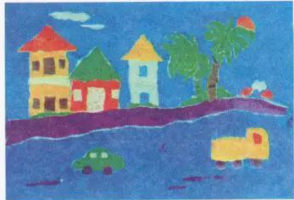
Phong cảnh Tranh xé dán giấy của học sinh