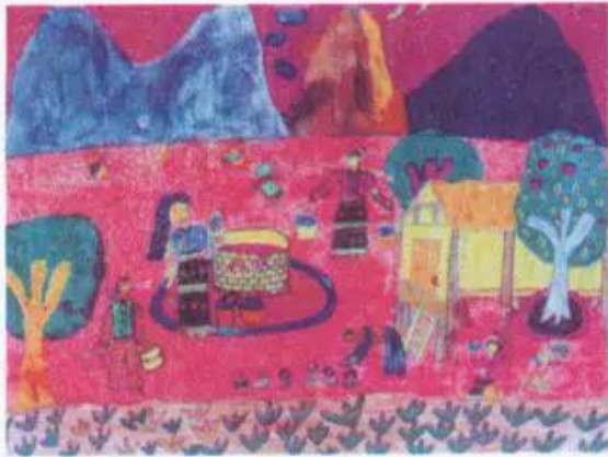
Phong cảnh miền núi Tranh màu nước và sấp màu của học sinh