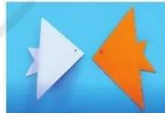
Hình 1. Gấp giấy thủ công thành hình con cá

Nếu em đã biết gấp giấy thủ công thành hình con cá như ở Hình 1, em hãy nêu các bước để các bạn làm theo. Nếu em chưa biết cách gấp, hãy làm theo các bước do thầy, cô hướng dẫn.