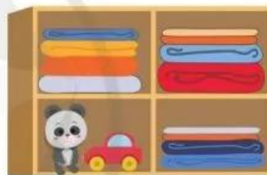
Hình 2. Tủ quần áo đã được sắp xếp phân loại