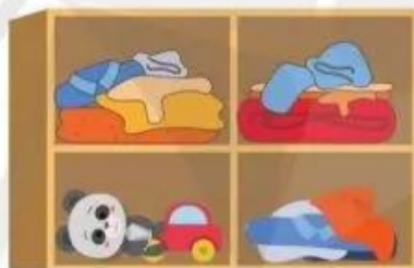
Hình 1. Tủ quần áo chưa được sắp xếp phân loại

❓ Hình 1 và Hình 2 đều là ảnh tủ đựng quần áo. Tủ nào sẽ giúp em tìm quần áo được nhanh hơn?