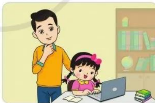
Hình 1. Bố hướng dẫn em học và giải trí trên Internet

Trên Internet có những thông tin độc hại như trò chơi bạo lực. Ngoài ra còn có những phim ảnh và thông tin khác không phù hợp với lứa tuổi học sinh. Bố, mẹ và thầy, cô sẽ giúp em nhận ra và tránh không xem những thông tin này trên Internet (Hình 1).