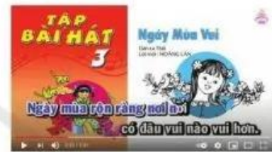
Hình 3. Video bài hát

? Hãy kể thêm những thông tin hữu ích trên Internet mà em biết.