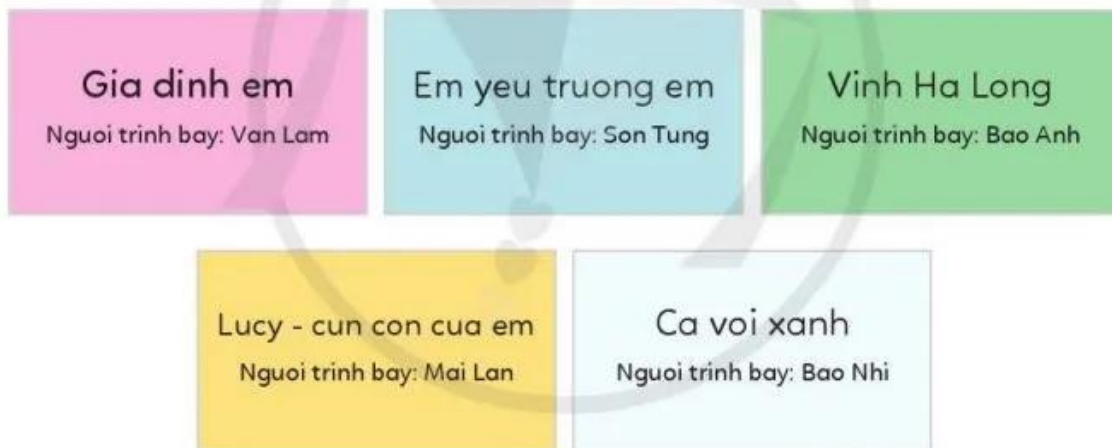
Hình 1. Một số chủ đề cho bài trình chiếu

Bài trình chiếu thường có chủ đề nhất định. Hình 1 giới thiệu một số chủ đề cho bài trình chiếu phù hợp với lứa tuổi của các em.