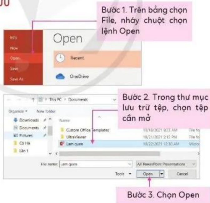
Hình 2. Các bước để mở tệp trình chiếu

❓ Em hãy mở tệp trình chiếu “Lam quen” đã tạo từ bài học trước. Trong trang trình chiếu thứ hai, nhập tiêu đề “Đây là hình ảnh loài vật yêu thích của tôi” (Hình 1). Lưu lại tệp trình chiếu đó.