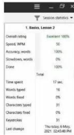
Hình 2. Kết quả tốc độ và độ chính xác gõ phím

Em có thể thấy mình tiến bộ sau mỗi lần tập gõ bằng phần mềm RapidTyping. Chọn Student statistics sẽ giúp em thấy được kết quả các lần luyện tập của mình (Hình 2).