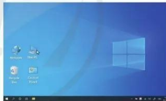
Hình 2. Màn hình nền