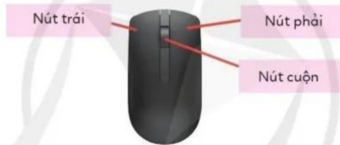
Hình 1. Chuột máy tính

Chuột có ba nút chính: nút trái, nút phải và nút cuộn (Hình 1).