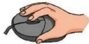
Hình 7. Động tác lăn nút cuộn chuột

Lăn nút cuộn chuột: Ngón tay trỏ đặt nhẹ lên nút cuộn chuột và di chuyển để lăn nút này (Hình 7).