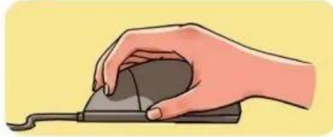
Hình 3. Một cách cầm chuột sai

? Em hãy nhận xét về cách cầm chuột trong Hình 3.