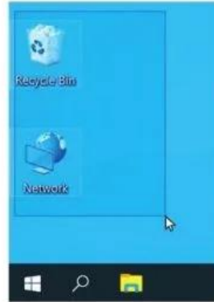
Hình 8. Động tác kéo thả chuột

Kéo thả chuột: Đồng thời nhấn, giữ nút chuột trái và di chuyển chuột đến vị trí mới, rồi thả ngón tay ra (Hình 8).