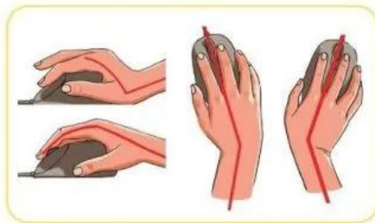
Hình 2a. Cách cầm chuột sai

? Em hãy quan sát Hình 2a và 2b. Từ đó, nói cho bạn biết cách cầm chuột như thế nào là đúng và như thế nào là sai?