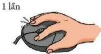
Hình 6. Động tác nháy chuột phải

Nháy chuột phải: Nhấn nút chuột phải rồi thả ngón tay ra ngay (Hình 6).