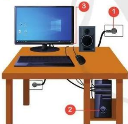
Hình 1. Các bước khởi động máy tính