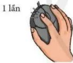
Hình 4. Động tác nháy chuột trái (nháy chuột)

Nháy chuột: Nhấn nút chuột trái rồi thả ngón tay ra ngay (Hình 4).