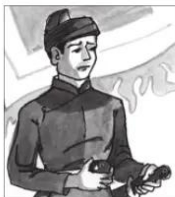
Trần Quốc Toản