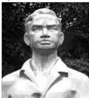
Lý Tự Trọng

Em biết gì về gương chiến đấu của các anh hùng liệt sĩ trong các tranh, ảnh dưới đây ?