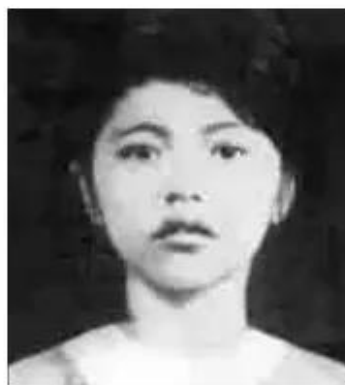
Võ Thị Sáu