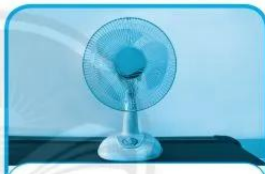
d) Đặt quạt ở vị trí phù hợp.