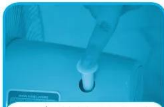
b) Điều chỉnh hướng gió của quạt cho phù hợp.