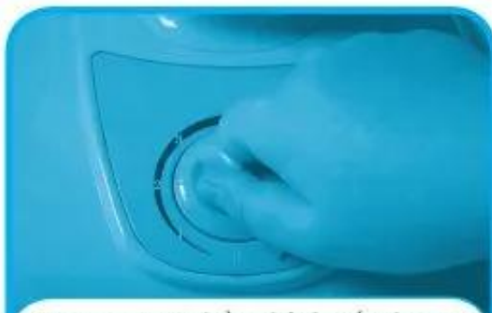
a) Bật quạt và điều chỉnh tốc độ quay của cánh quạt phù hợp với nhu cầu.

5. Em hãy quan sát những hình ảnh mô tả các bước thực hành sử dụng quạt điện và nối các bước theo thứ tự đúng.