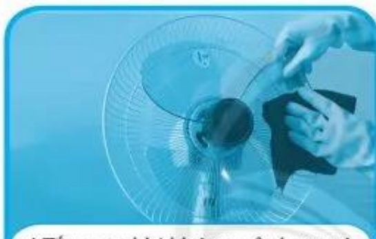
c) Tắt quạt khi không sử dụng và vệ sinh quạt khi đã rút dây nguồn.