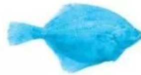
cá thừn b.....