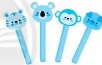
thổi c..... bộ đồ ch..... thú r..... que