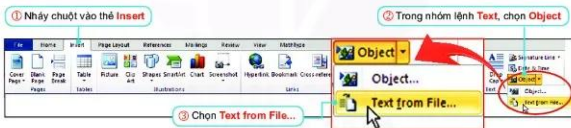
Hình 5.25. Tập hợp nội dung vào một tệp