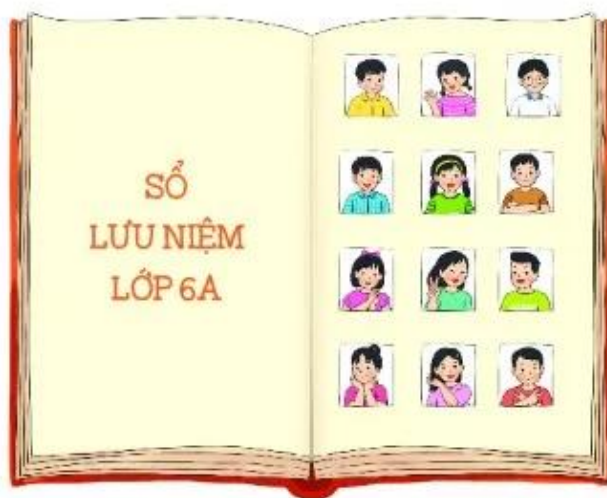
Hình 5.27. Cuốn sổ lưu niệm

Hãy tưởng tượng các em đã là người lớn. Cả lớp gặp lại nhau trong một lần họp lớp ở tương lai 50 năm sau. Hãy cùng xem lại cuốn sổ lưu niệm và nghĩ về câu hỏi "Tại sao chúng ta lại đưa nội dung này vào sổ?". Các nhóm hãy chia sẻ với cả lớp sản phẩm của mình và cả lớp cùng thảo luận để cuốn sổ lưu niệm chung của cả lớp có nội dung đầy đủ và trình bày đẹp nhất.