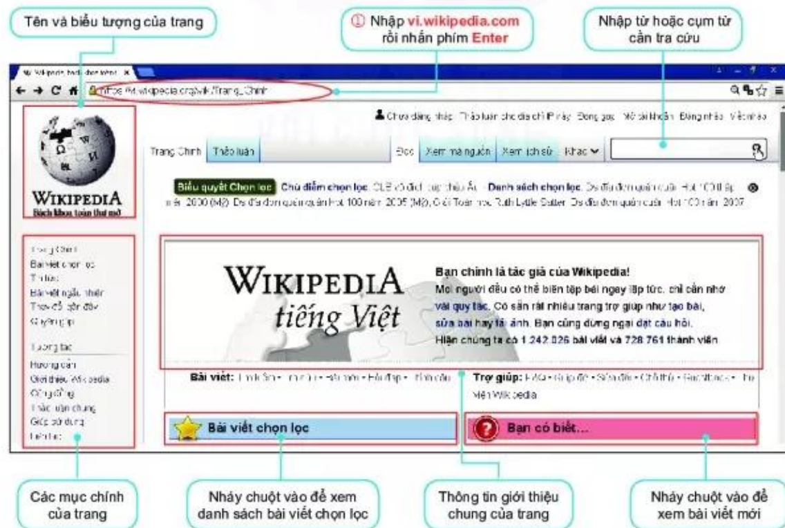
Hình 3.2. Trang Bách khoa toàn thư mở tiếng Việt

Trang Bách khoa toàn thư mở được hiển thị như Hình 3.2.