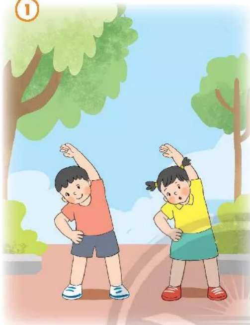
Rèn luyện thân thể