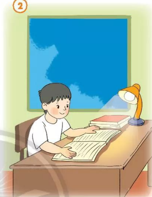
Chăm chỉ học tập