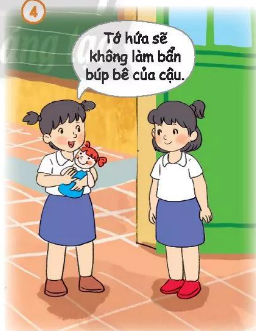
Có trách nhiệm