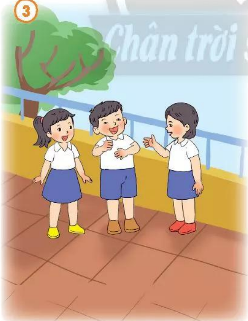
Thân thiện với mọi người