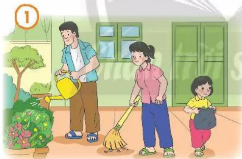
Cùng làm việc nhà

1. Trao đổi về những hoạt động chung của gia đình em.