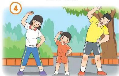
Tập thể dục

2. Chia sẻ cảm xúc của em khi tham gia các hoạt động chung với gia đình.