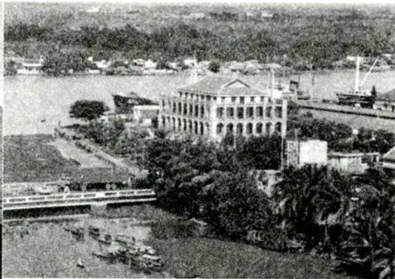
Bến Nhà Rộng - Thành phố Hồ Chí Minh