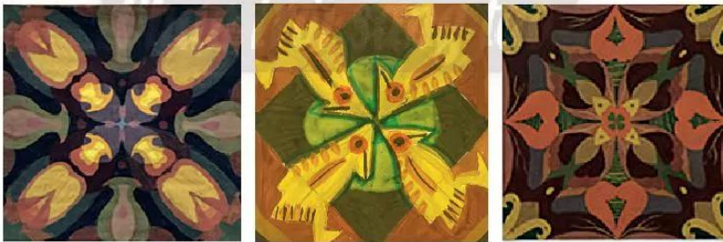
Hình tham khảo

• HS tự đánh giá (Tô màu vào mức đánh giá)