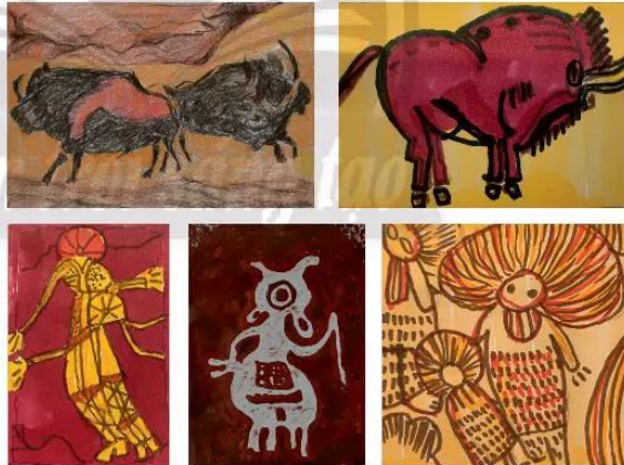
Hình tham khảo