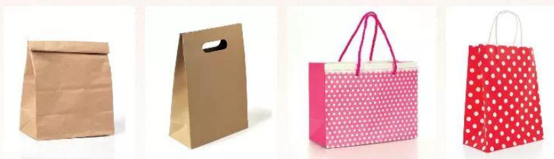
Hình tham khảo

1 Vẽ hình chiếc túi đựng quà tặng theo ý thích.