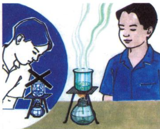
Hình 2.5. Cách đun chất lỏng trong cốc thuỷ tinh

Đun hoá chất lỏng trong cốc thuỷ tinh phải dùng lưới (thép không gỉ hoặc đồng) lót dưới đáy cốc thuỷ tinh để tránh nứt vỡ. Không được cúi mặt gần miệng cốc đang đun nóng để tránh hoá chất sôi bắn vào mắt và mặt (hình 2.5).