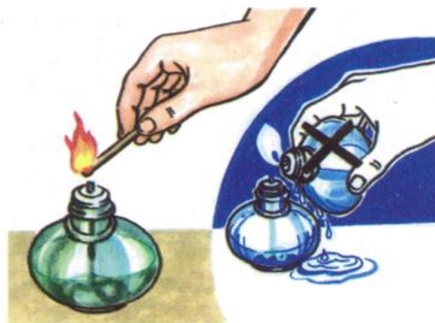
Hình 2.6. Cách châm lửa đèn cồn

Trong thí nghiệm thực hành hoá học thường dùng cặp gỗ hoặc kim loại, cặp ở vị trí cách miệng ống nghiệm bằng \frac{1}{3} chiều dài của ống nghiệm. Khi đã cho ống nghiệm vào cặp rồi, chỉ nên nắm chắc nhánh dài của cặp và đặt ngón tay cái lên nhánh ngắn, không dùng bàn tay nắm cả hai nhánh của cặp.