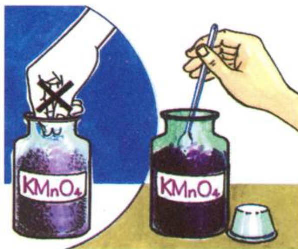
Hình 2.4. Cách lấy hoá chất rắn

Lấy hoá chất lỏng phải dùng ống hút nhỏ giọt. Khi đổ hoá chất từ lọ này sang lọ khác phải dùng phễu. Khi rót hoá chất vào ống nghiệm phải dùng kẹp giữ ống nghiệm, để tránh hoá chất dấy ra tay.