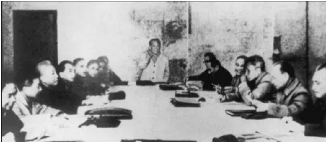
Hình 88. Bộ Chính trị họp Hội nghị mở rộng, quyết định kế hoạch giải phóng miền Nam