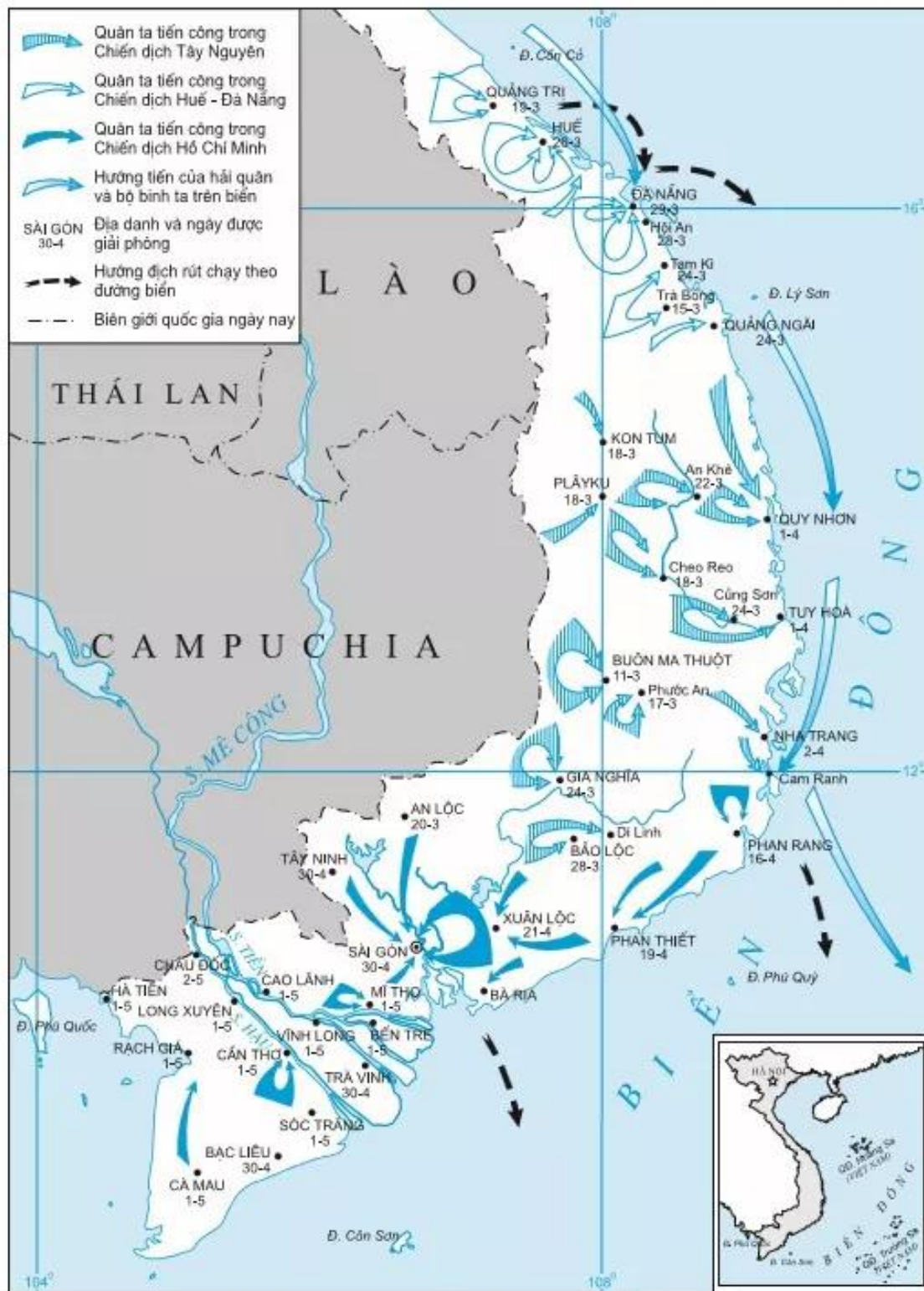
Hình 89. Lược đồ diễn biến cuộc Tổng tiến công và nổi dậy Xuân 1975