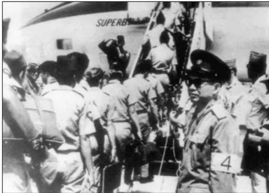
Hình 87. Quân đội Mỹ rút khỏi miền Nam Việt Nam

Nắm bắt tình hình trên, tháng 7 – 1973, Ban Chấp hành Trung ương Đảng họp Hội nghị lần thứ 21. Trên cơ sở nhận định kẻ thù vẫn là đế quốc Mỹ và tập đoàn Nguyễn Văn Thiệu – kẻ đang phá hoại hoà bình, hoà hợp dân tộc, ngăn cản nhân dân ta đi tới độc lập, tự do, thống nhất Tổ quốc – Hội nghị nêu rõ nhiệm vụ cơ bản của cách mạng miền Nam trong giai đoạn hiện tại là tiếp tục cuộc cách mạng dân tộc dân chủ nhân dân. Hội nghị nhấn mạnh trong bất cứ tình hình nào cũng phải tiếp tục con đường cách mạng bạo lực, phải nắm vững chiến lược tiến công, kiên quyết đấu tranh trên cả ba mặt trận : quân sự, chính trị, ngoại giao.