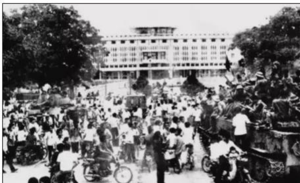
Hình 92. Dinh Độc Lập trong ngày Sài Gòn giải phóng

Thắng lợi của nhân dân ta, thất bại của đế quốc Mĩ đã tác động mạnh đến tình hình nước Mĩ và thế giới, là nguồn cổ vũ to lớn đối với phong trào cách mạng thế giới, nhất là đối với phong trào giải phóng dân tộc.