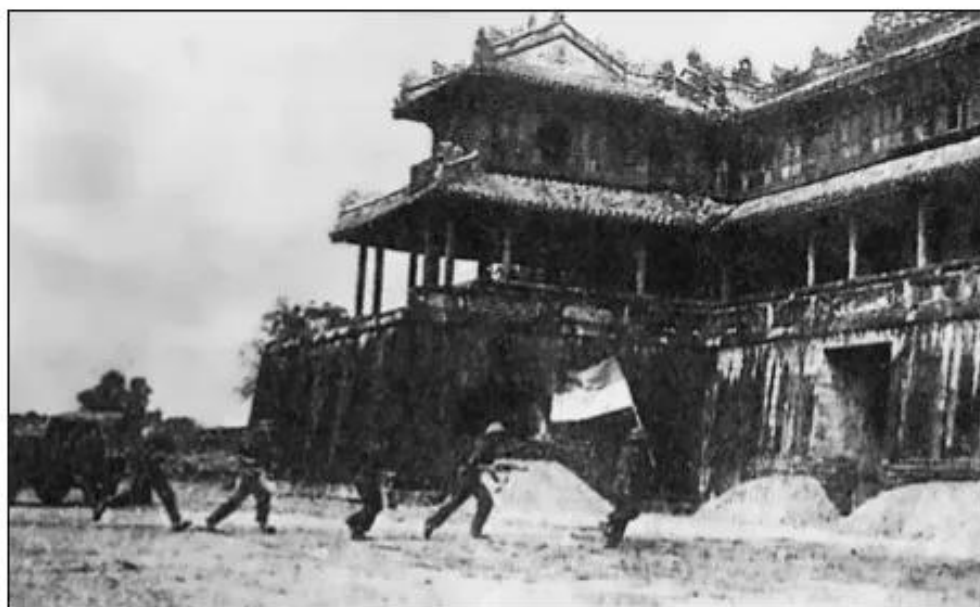
Hình 90. Quân ta tiến vào cố đô Huế

Phát hiện địch co cụm ở Huế, ngày 21 – 3, quân ta đánh thẳng vào căn cứ địch, chặn các đường rút chạy của chúng, hình thành thế bao vây trong thành phố. Đúng 10 giờ 30 ngày 25 – 3, quân ta tiến vào cố đô Huế, đến hôm sau (26 – 3) thì giải phóng thành phố và toàn tỉnh Thừa Thiên.