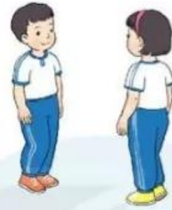
Luyện tập cặp đôi