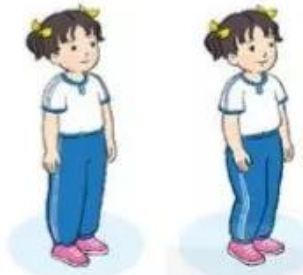
Luyện tập cá nhân