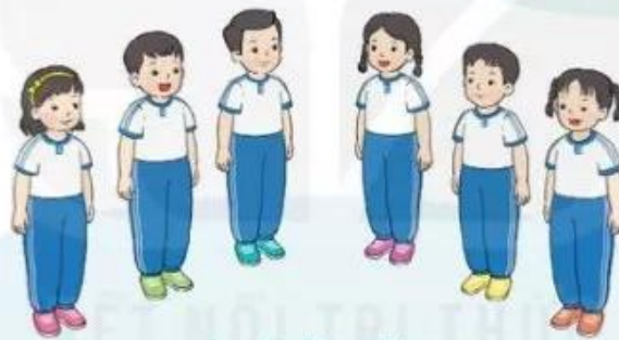
Luyện tập nhóm