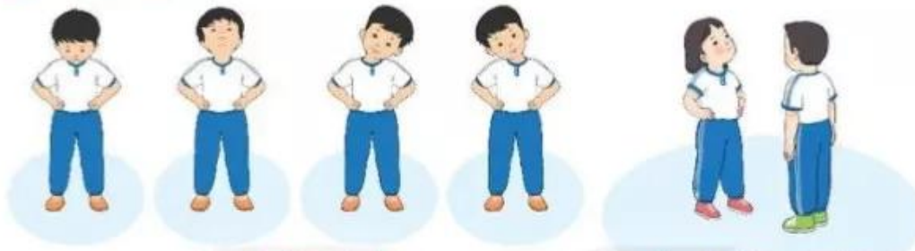
Luyện tập cá nhân