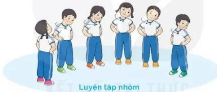
Luyện tập nhóm