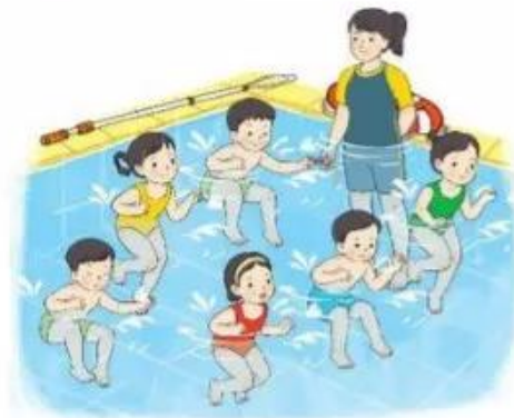
Luyện tập nhóm