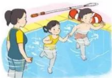
Luyện tập cặp đôi