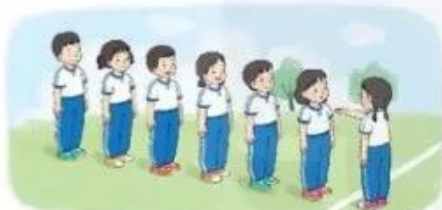
Tập hợp 1 hàng dọc