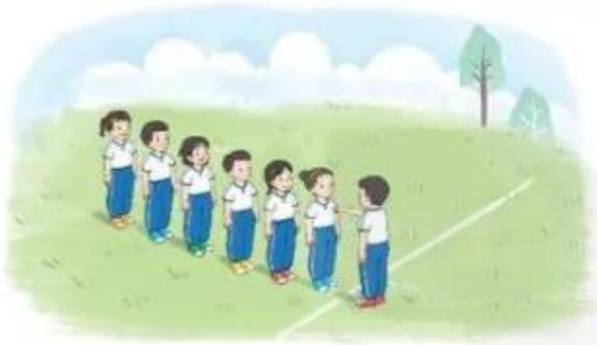
Tập hợp 1 hàng dọc