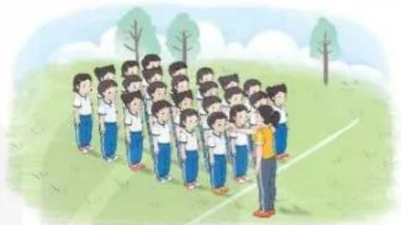
Tập hợp 4 hàng dọc