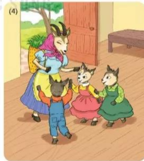
Nghe đúng tiếng mẹ (...)