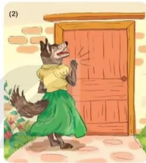
Một con sói (...)