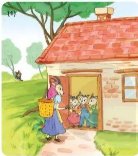
Trong khu rừng nọ (...)