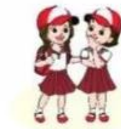
c. trò chuyện

2. Em hãy bắt chước các âm thanh có trong hình bên dưới và chỉ ra sự vật nào phát ra âm thanh to, sự vật nào phát ra âm thanh nhỏ.