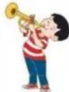
b. thổi kèn