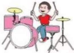
a. đánh trống

1. Hoạt động nào trong mỗi hình sau có thể phát ra âm thanh cao?