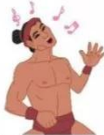
b. Thạch Sanh hát