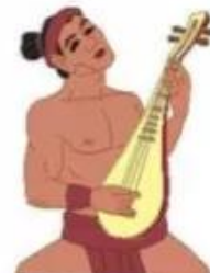
c. Thạch Sanh gảy đàn