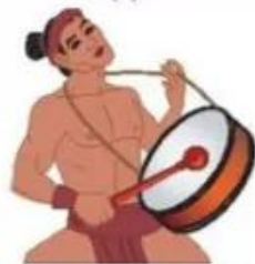
a. Thạch Sanh đánh trống

2. Thạch Sanh đã làm gì khiến công chúa nói được và quên giấc ngủ chày?