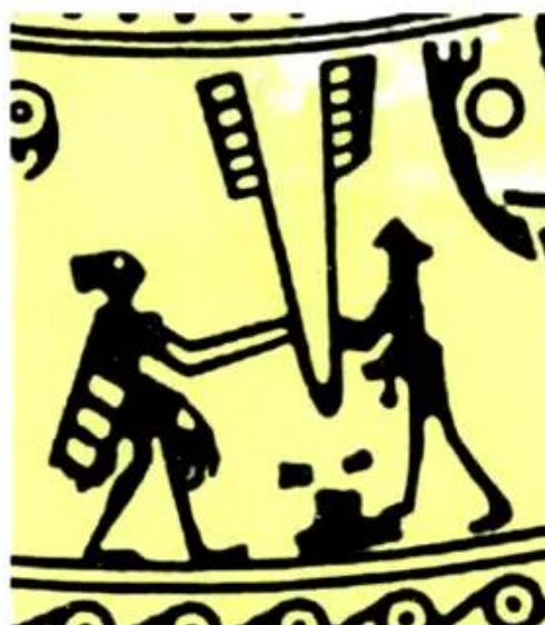
Hình 7. Cảnh gĩa gạo (trang trí trên trống đồng)