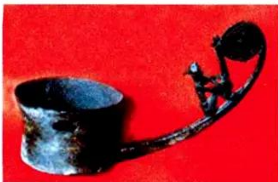
Hình 5. Muôi (vá, môi) bằng đồng