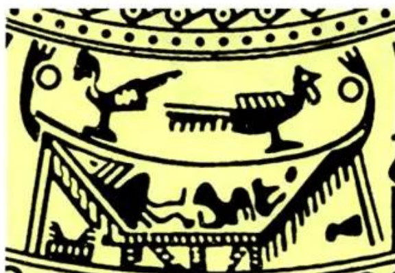
Hình 6. Hình nhà sàn (trang trí trên trống đồng)