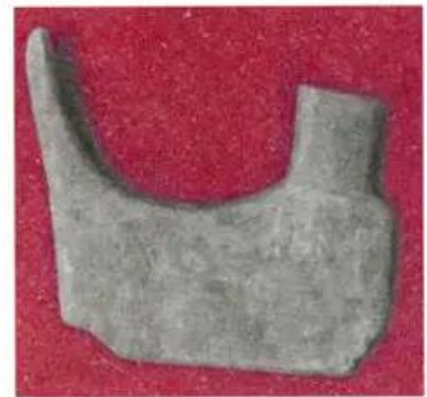
Hình 4. Rìu lưỡi xéo bằng đồng

– Xã hội Văn Lang có những tầng lớp nào ? Em thử vẽ sơ đồ thể hiện các tầng lớp đó.