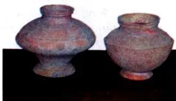
Hình 9. Đồ gốm thời Hùng Vương