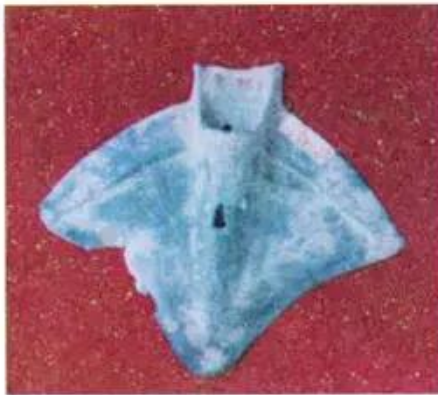
Hình 3. Lưỡi cày đồng

– Em hãy xác định trên lược đồ hình 1 những khu vực mà người Lạc Việt đã từng sinh sống.