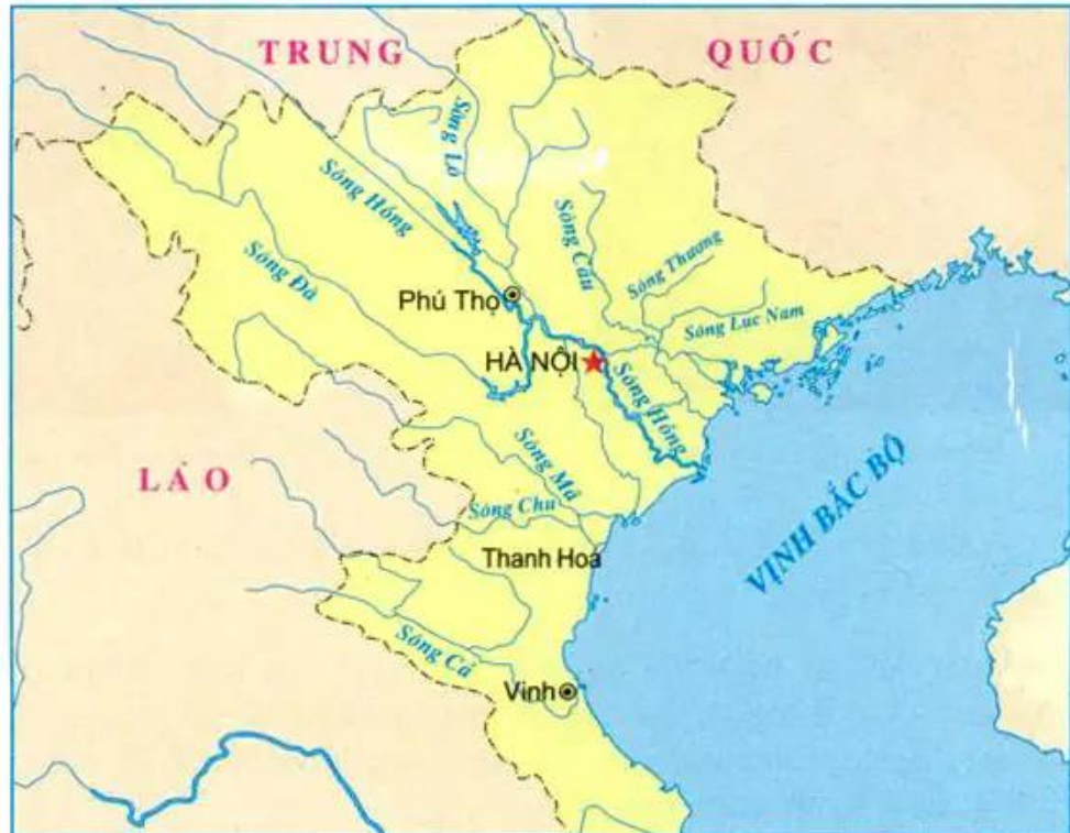
Hình 1. Lược đồ Bắc Bộ và Bắc Trung Bộ ngày nay