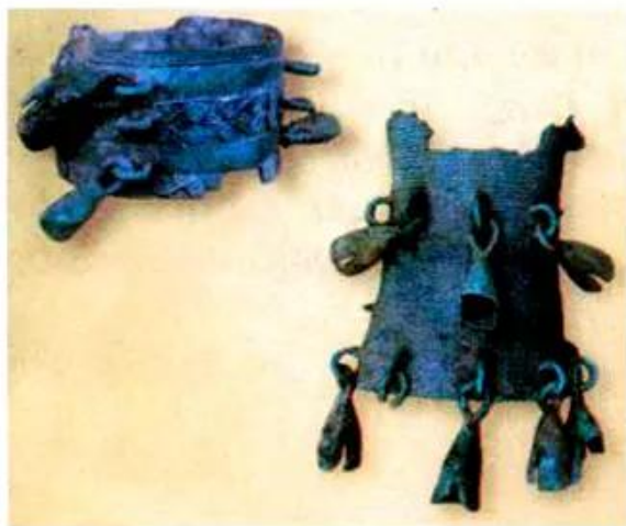
Hình 8. Vòng trang sức bằng đồng