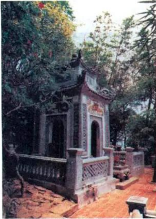
Hình 2. Lăng vua Hùng (Phú Thọ)

Khoảng năm 700 TCN, ở khu vực sông Hồng, sông Mã và sông Cả, nơi người Lạc Việt sinh sống, nước Văn Lang đã ra đời. Đứng đầu nhà nước có vua, gọi là Hùng Vương. Giúp vua Hùng cai quản đất nước có các lạc hầu , lạc tướng . Vua, lạc hầu, lạc tướng thuộc tầng lớp giàu có trong xã hội. Dân thường thì được gọi là lạc dân , tầng lớp thấp kém, nghèo hèn nhất là nô tì. (1)