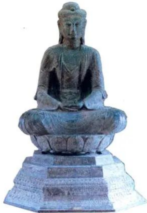
Hình 1. Tượng Phật A-di-đà (chùa Phật Tích, Bắc Ninh)

Thời Lý, chùa mọc lên khắp kinh thành, làng xã. Triều đình bỏ tiền ra xây dựng hàng trăm ngôi chùa. Ở các làng, nhân dân cũng đóng góp