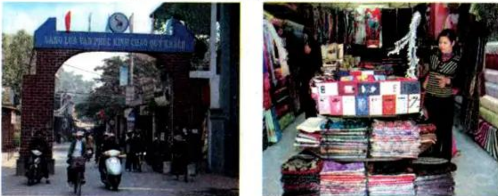
Hình 10. Làng lụa Vạn Phúc

– Hãy kể tên những danh lam thắng cảnh, di tích lịch sử nổi tiếng của Hà Nội mà em biết.