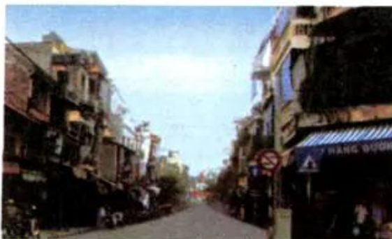
Hình 3. Khu phố cổ