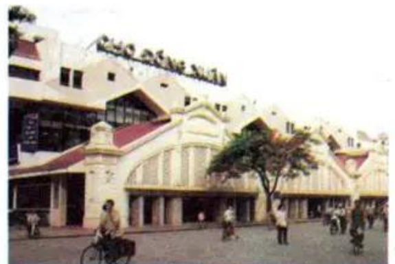
Hình 8. Chợ Đồng Xuân