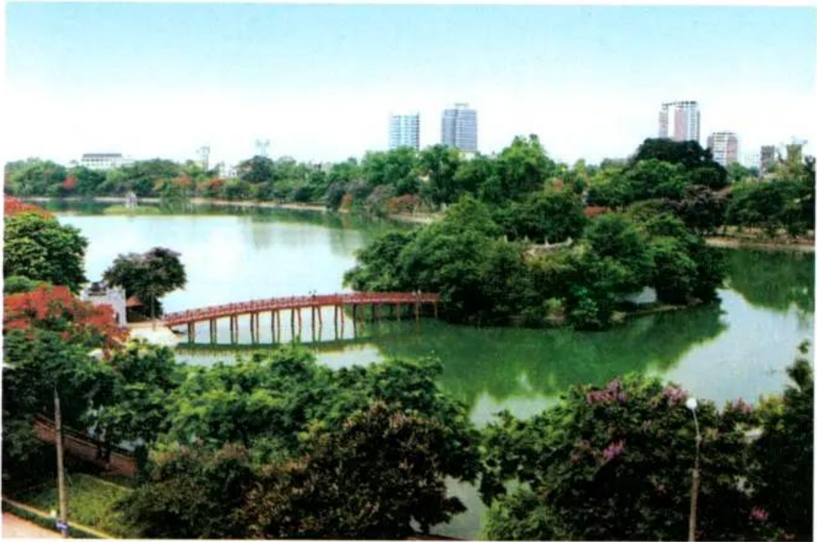
Hình 2. Hồ Hoàn Kiếm

Hà Nội cổ có các phố phường làm nghề thủ công và buôn bán ở gần hồ Hoàn Kiếm. Hiện nay, một số phố vẫn là nơi buôn bán tấp nập và mang các tên gắn với những hoạt động sản xuất, buôn bán trước đây như Hàng Đào, Hàng Đường, Hàng Mã,... Cùng với thời gian, Hà Nội ngày càng được mở rộng và hiện đại hơn.