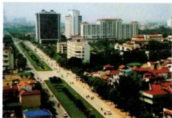
Hình 4. Khu phố mới

– Quan sát các hình 3, 4, em hãy cho biết khu phố cổ và khu phố mới có gì khác nhau (về nhà cửa, đường phố,...) ?