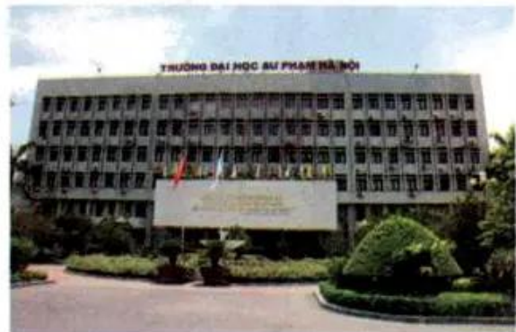
Hình 6. Trường Đại học Sư phạm Hà Nội