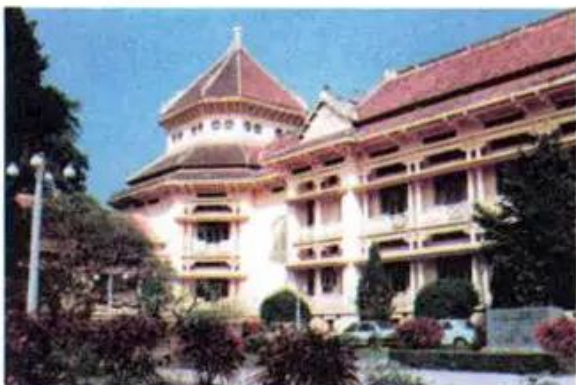
Hình 7. Viện Bảo tàng Lịch sử Việt Nam