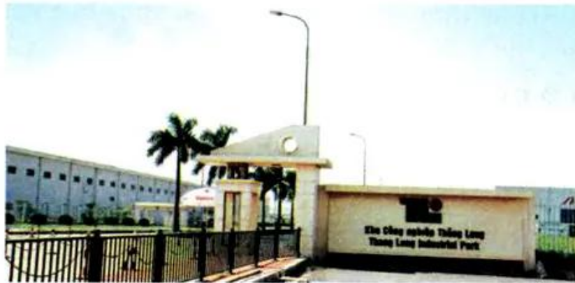
Hình 9. Khu công nghiệp Thăng Long