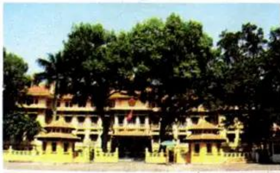
Hình 5. Trụ sở Bộ Ngoại giao

– Quan sát các hình dưới đây, chỉ ra hình ảnh thể hiện Hà Nội là trung tâm chính trị, văn hoá, khoa học, kinh tế.