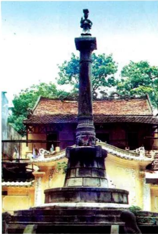
Hình 2. Đền thờ vua Lê Thái Tổ (Hà Nội)

Lọt vào giữa trận địa “mưa tên”, Liễu Thăng và đám kị binh tối tăm mặt mũi. Liễu Thăng bị giết. Quân bộ theo sau cũng bị phục binh của ta từ hai bên sườn núi và lòng khe, nhất tề xông ra tấn công. Quân địch hoảng loạn, lại nghe tin Liễu Thăng tử trận, càng khiếp sợ. Hàng vạn quân Minh bị giết, số còn lại rút chạy.