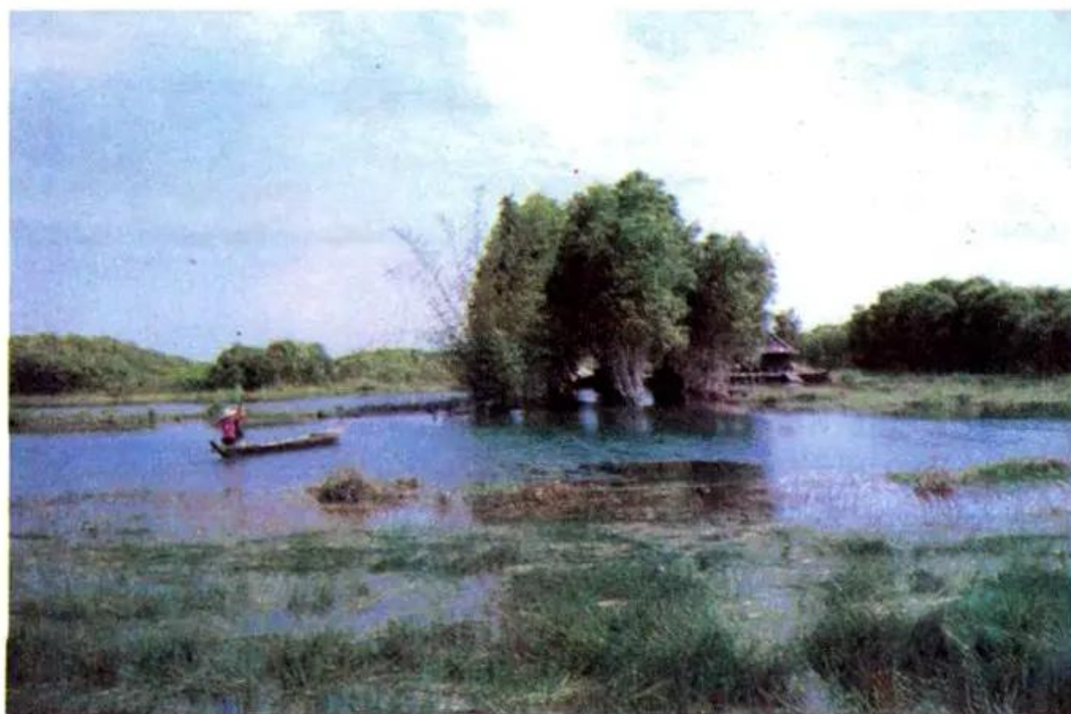
Hình 1. Đồng Tháp Mười

Đồng bằng Nam Bộ do phù sa của hệ thống sông Mê Công và sông Đồng Nai bồi đắp nên. Đây là đồng bằng lớn nhất cả nước, có diện tích lớn gấp hơn ba lần đồng bằng Bắc Bộ. Phần Tây Nam Bộ (còn gọi là đồng bằng sông Cửu Long) có nhiều vùng trũng dễ ngập nước như Đồng Tháp Mười, Kiên Giang, Cà Mau. Ngoài đất phù sa màu mỡ, đồng bằng còn có nhiều đất phèn, đất mặn cần phải cải tạo.