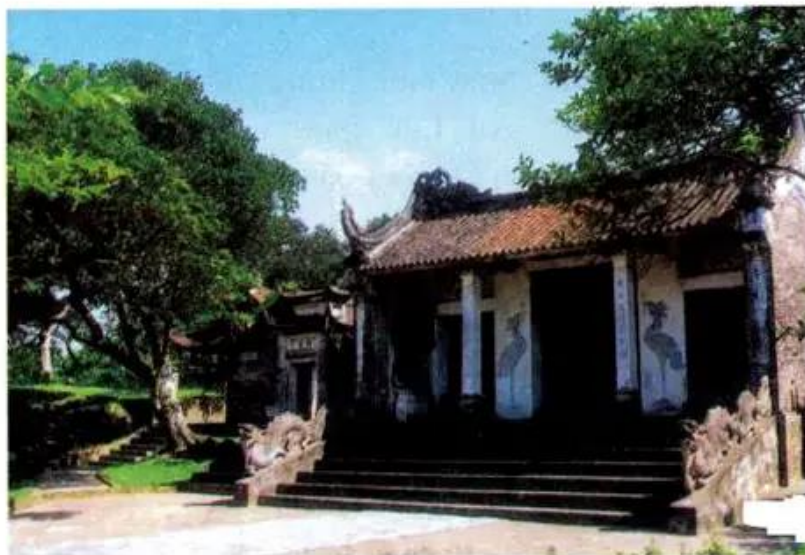
Hình 1. Đền thờ An Dương Vương ở Cổ Loa (Đông Anh, Hà Nội)

Triệu Đà – vua của nước Nam Việt (miền Nam Trung Quốc ngày nay), nhiều lần kéo quân sang xâm lược nước Âu Lạc. Người Âu Lạc đoàn kết một lòng chống giặc, lại có tướng chỉ huy giỏi, vũ khí tốt, thành lũy kiên cố nên lần nào quân giặc cũng bị đánh bại.