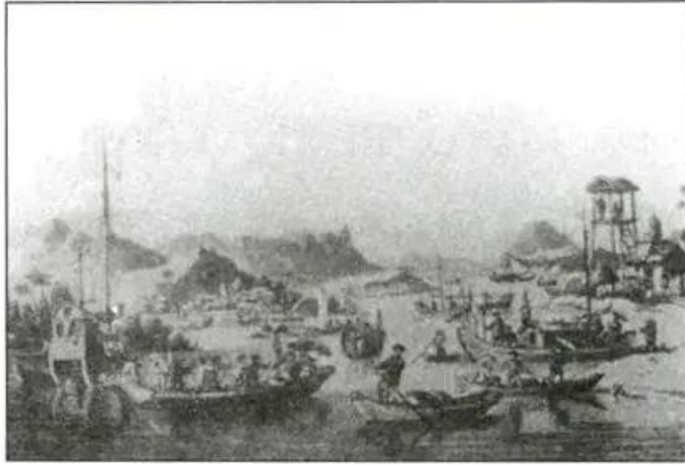
Hình 2. Một góc Hội An ở thế kỉ XVII (tranh cổ)

Hội An là thành phố cảng lớn nhất ở Đàng Trong. Các nhà buôn Nhật Bản cùng với một số cư dân địa phương đã dựng nên thành phố này. Năm 1618, một giáo sĩ người Pháp đã nhận xét Hội An “là hải cảng đẹp nhất, nơi mà thương nhân ngoại quốc thường lui tới buôn bán”.