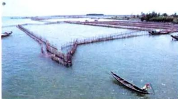
Hình 3. Phá Tam Giang

Các đồng bằng duyên hải miền Trung nhỏ, hẹp vì các dãy núi lan ra sát biển.