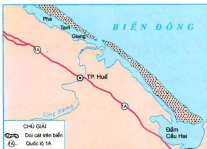
Hình 2. Lược đồ đầm, phá ở Thừa Thiên - Huế